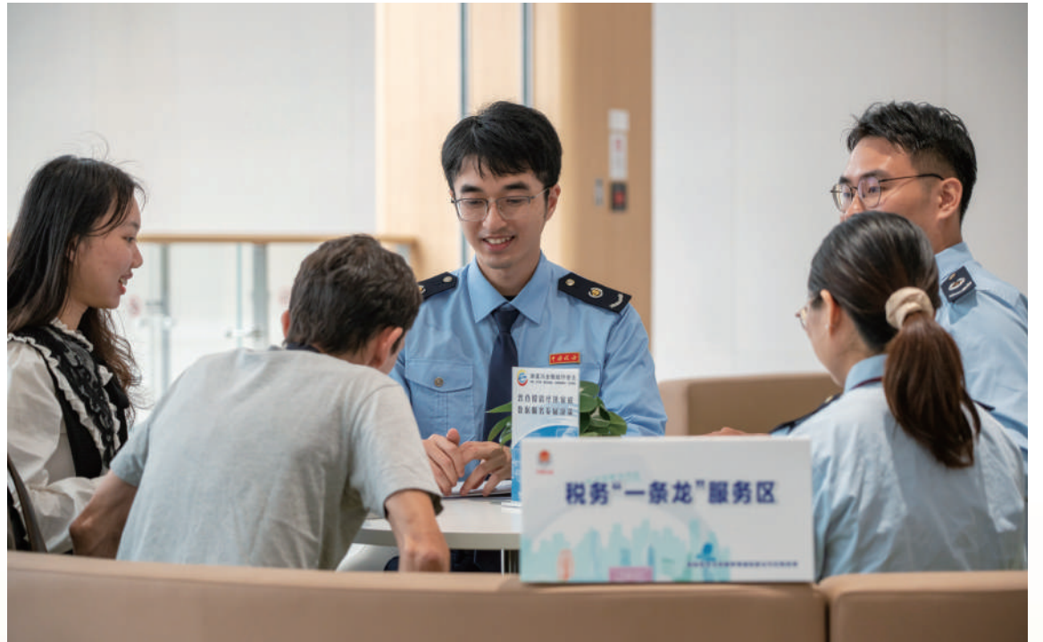
▲稅務一條龍服務區。