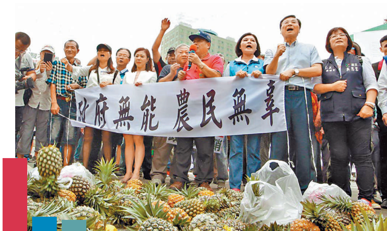
▲台灣民眾舉行集會，批評民進黨當局破壞兩岸關係，影響農民生計。資料圖片