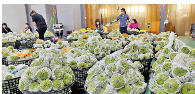
▲多年來，大陸是台灣農產品的重要市場。圖為台灣農民對釋迦進行包裝和儲存。資料圖片

台灣大學農業經濟學系教授徐世勛說，除了匯率貶值外，其實更要關注是否受到日本與多國簽署的貿易協定生效的影響，例如《區域全面經濟夥伴關係協定》(RCEP)、《全面與進步跨太平洋夥伴關係協定》(CPTPP)