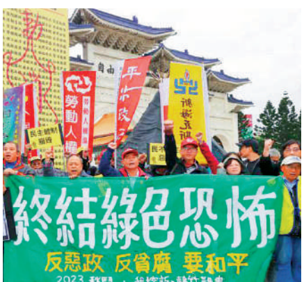
▲台灣民間團體將舉行遊行，批評民進黨當局政績不彰。

主辦單位指出，今年「秋門」主題為「終結綠色恐怖」，將訴求「反惡政、反貪腐、要和平」，控訴的主題包括貧富差距、民不聊生、兵兇戰危、環境掠奪及民主崩毀。重返2008年對民進黨的抗議行動，此次「秋門」再次寫下題為「罄竹難書」的抗議文件，批評8年來膨脹成綠色恐怖巨獸的民進黨當局。