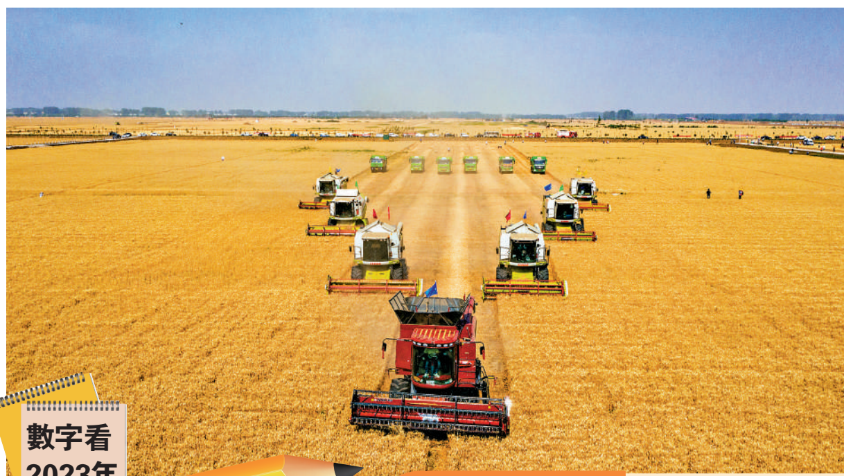
▲國家統計局12月11日發布的數據顯示，2023年全國糧食生產再獲豐收，全年糧食產量再創歷史新高。全國糧食總產量13908億斤，同比增長1.3%，連續9年穩定在1.3萬億斤以上。圖為農機手在田野收割。