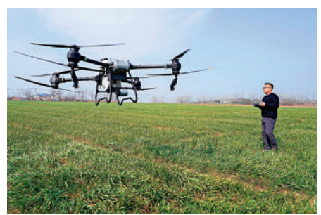
▲安徽省滁州市水口鎮擁巷村「新農人」操作植保無人機噴灑除草劑。

中共中央總書記、國家主席、中央軍委主席習近平對「三農」工作作出重要指示。習近平指出，2023年，我們克服較為嚴重的自然災害等多重不利影響，糧食產量再創歷史新高，農民收入較快增長，農村社會和諧穩定。推進中國式現代化，必須堅持不懈夯實農業基礎，推進鄉村全面振興。要以新時代中國特色社會主義思想為指導，全面貫徹落實黨的二十大和二十屆二中全會精神，錨定建設農業強國目標，把推進鄉村全面振興作為新時代新徵程「三農」工作的總抓手，學習運用「千萬工程」經驗，因地制宜、分類施策，循序漸進、久久為功，集中力量抓好辦成一批群眾可感可及的實事。要全面落實糧食安全黨政同責，堅持穩面積、增產產兩手發力。要樹立大農業觀、大食物觀，農林牧漁並舉，構建多元化食物供給體系。要守住耕地這個命根子，堅決整治亂佔、破壞耕地違法行為，加大高標準農田建設投入和管護力度，確保耕地數量有保障、質量有提升。要強化科技和改革雙輪驅動，加大核心技术攻關力度，改革完善「三農」工作體制機制，為農業現代化增動力、添活力。要抓好災後恢復重建，全面提升農業防災減災救災能力。要確保不發生規模性返貧，抓好防止返貧監測，落實幫扶措施，增強內生動力，持續鞏固拓展脫貧攻堅成果