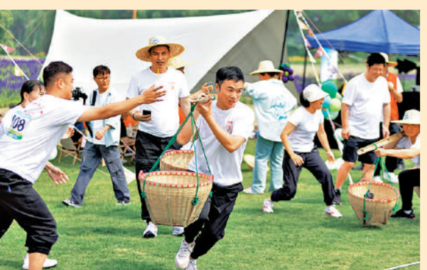
▲5月26日，浙江省湖州市2023年「我們的村運」活動在南太湖新區塘甸村舉行，12支代表隊百多名農民運動員參加比賽。求是網

【千村示範、萬村整治】工程（簡稱「千萬工程」），是習近平總書記在浙江工作期間親自謀劃、親自部署、親自推動的一項重大決策。2003年6月，時任浙江省委書記習近平在廣泛深入調查研究基礎上，提出從全省近4萬個村莊中選擇1萬個左右的行政村進行全面整治，把其中1000個左右的中心村建成全面小康示範村，在浙江大地展開了「千萬工程」的時代畫卷。 黨的十八大以來，習近平總書記先後4次作出重要指示，「千萬工程」在習近平總書記直接關懷下不斷取得新成就。16年來，浙江深入實施「八八戰略」，積極踐行「绿水青山就是金山銀山」的重要理念，持續深化「千萬工程」，造就了萬千美麗鄉村。2018年9月，「千萬工程」以扎實的農村人居環境整治工作、生態宜居的美麗鄉村建設成就，獲得聯合國環保最高榮譽——「地球衛士獎」。求是網