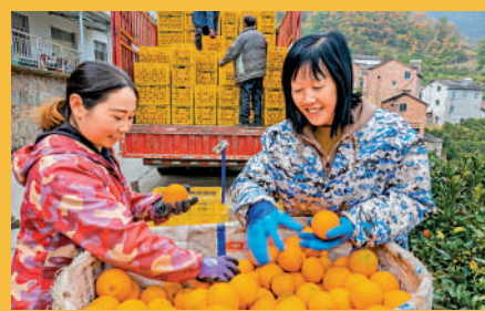
▲12月13日，湖北宜昌市秭歸縣郭家壩鎮柏楊坪村果農在對剛收穫的臍橙進行分選裝車。