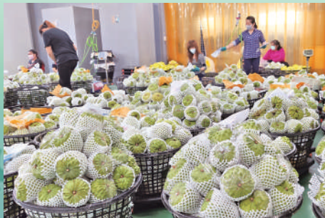
▲台灣釋迦改善質量後，獲准恢復出口大陸。