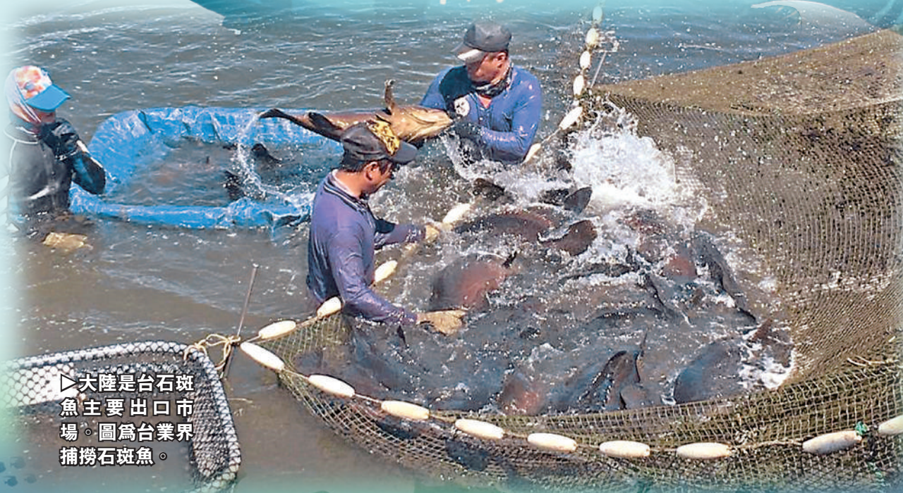
▶大陸是台石斑魚主要出口市場。圖為台業界捕撈石斑魚。