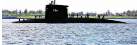
▲台軍「海虎」潛艇落水意外，3人仍失蹤。

高達30年以上，也已被列為「高齡潛艇」。它是台灣海軍「劍龍專案」中，於1982年委託荷蘭建造的劍龍級潛艦中的其中一艘（另一艘是「海龍」軍艦）。於1986年下水，1988年7月4日服役。全長66.92米、全寬8.4米、排水量2300噸、水下最高航速為20節、自持力60天、可搭載66名官兵。