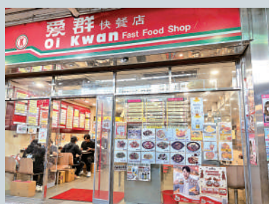
◀愛群快餐店自八十年代起開設，是馳名的街坊快餐店。