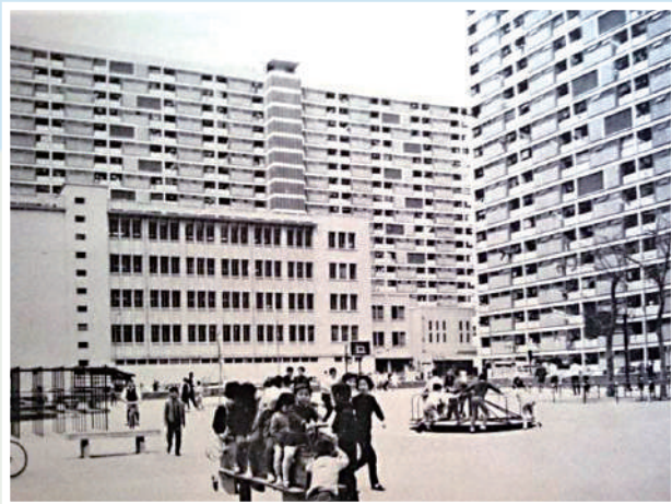
◀彩虹邨已有逾60年歷史，初步會分三期重建。 受訪者提供