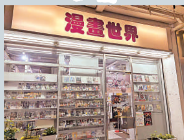
◀漫畫世界是現時碩果僅存的舊式漫畫店。