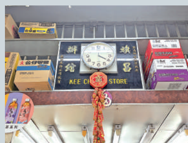
◀旗昌辦館店內仍掛有舊日的牌匾，歷史感滿滿。