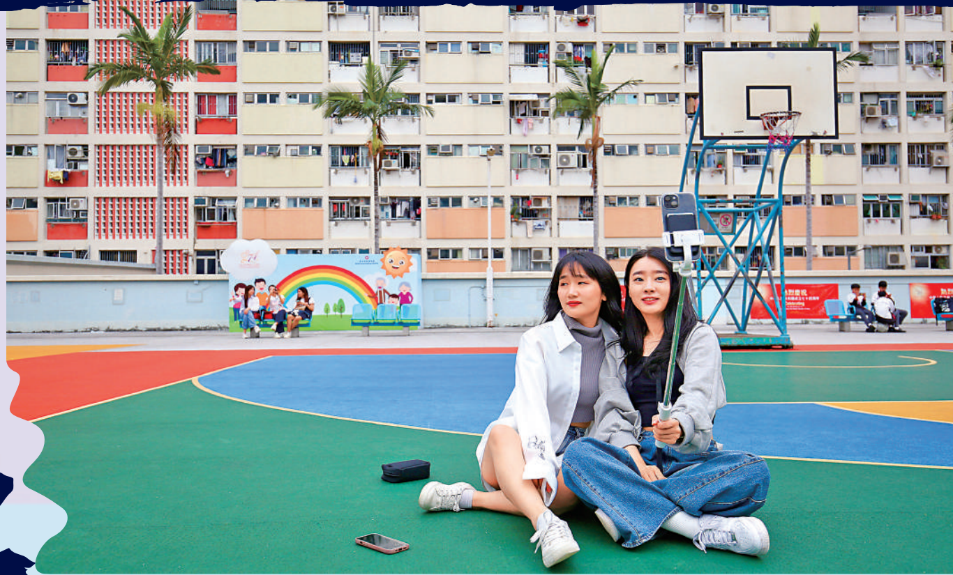
◀彩虹邨七彩大廈外牆奪目，近年成為打卡熱點。