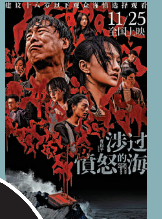
▲電影《涉過憤怒的海》呈現瘋狂失控的兩代關係。