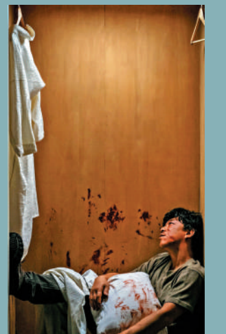
▲金隕石執意為女復仇，卻從無深究女兒為何不快樂。

近年，懸疑犯罪題材電影發生了一種標榜「反轉」的創作趨勢。這類作品已經形成了標準化的影像符碼和流水線的生產模式：在空間上，多為東南亞異域小城；在情節上，基本都是主角為以女性為主的遇害親人復仇。反轉的重點在於，兇手被法外力量以殘忍且解氣的方式捉弄並懲罰，創作者們認為觀眾尤其喜歡這種處理，兇手被非理性、同樣野蠻甚至犯罪的手段，證明「血債血償」「以暴制暴」的感性合理性。