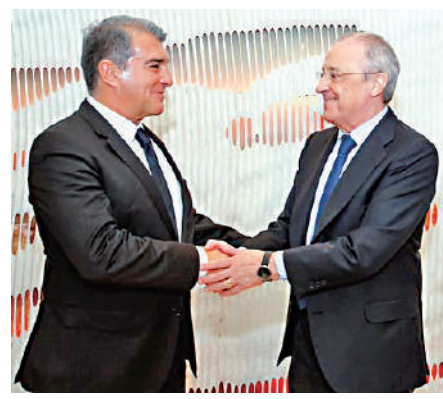
▲拿樸達（左）與佩雷斯（右）力撐歐超聯賽事。

英超賽會期後亦發表聲明：「今天的裁決並沒有支持歐超級，而英超聯賽也繼續拒絕任何此類理念。球迷對比賽十分重要，他們一再明確反對「脫鉤」以切斷國內足球和歐洲足球之間的聯繫。」