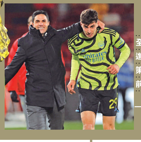
▲阿迪達（左）已找到起用夏維斯的正確方向。