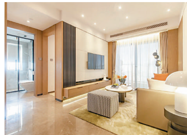
▲新世界星輝設計注重各項細節，讓住戶感受媲美星級酒店的舒適體驗。

新世界星輝緊鄰新白廣城際鐵路，一站接駁新塘的廣州東部交通樞紐中心，兩站到黃埔，三站到天河。商業配套方面，項目樓下是自置的商業星光道，為廣州東全新潮流商業地標，參照珠江新城廣粵天地的運營模式，未來會引入Costa、華為等逾100個中高端品牌。