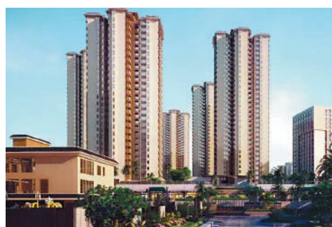
▲珠江·花嶼花城由8幢26至32層高住宅組成。