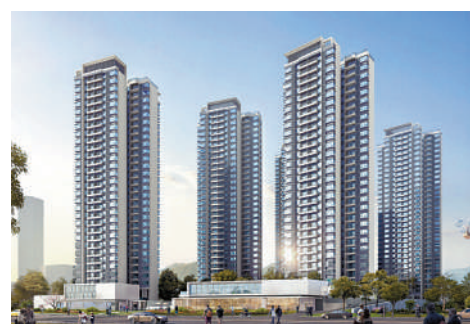
▲保利瓏悅位於廣深科創走廊，周邊有不少高新尖端企業。