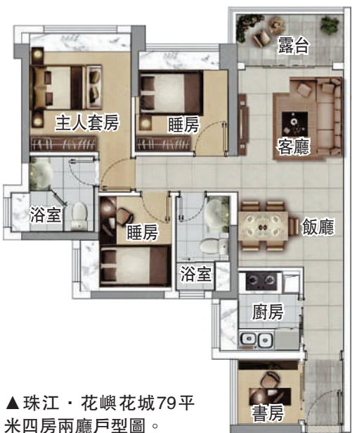
▲珠江·花嶼花城79平米四房兩廳戶型圖。

教育方面，項目自建9班公立幼兒園，周邊學校眾多，包括永寧街中心小學、省一級清華萬博實驗學校（幼兒園、小學）、永新中學等。商業方面，項目毗鄰3萬平米的悠方商業廣場，步行200米到廣州東部首個世界級國際文旅綜合體廣州鈞明歡樂世界。項目周邊5公里集雲七大商圈，包括萬達廣場、合生匯、華南最大的永旺夢樂城等商場，開車僅需10分鐘可達。