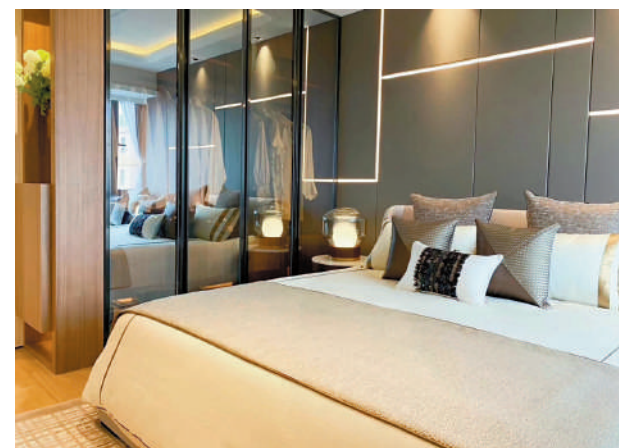
▲新世界星輝單位設計充滿現代感，睡房牆身裝上條子燈，增添室內格調。