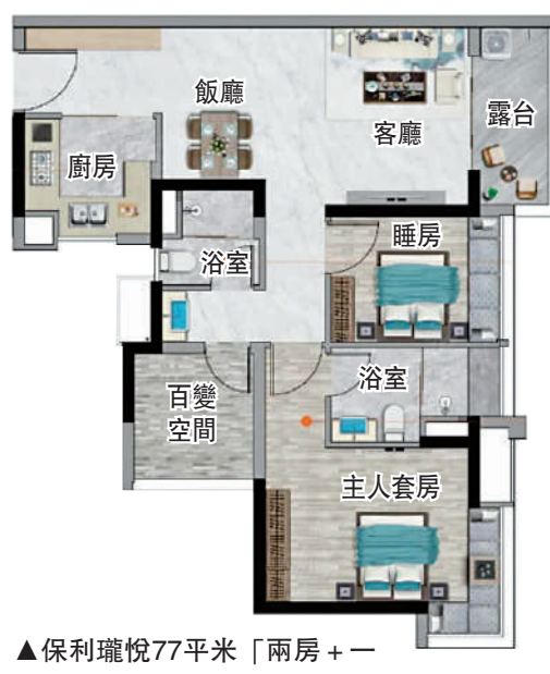
▲保利瓏悅77平米「兩房+一房兩廳」戶型圖。