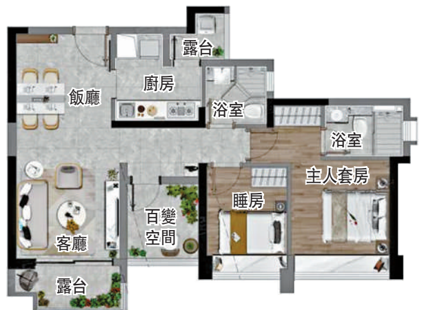
▲新世界星輝88平米「兩房+一房兩廳」戶型圖。