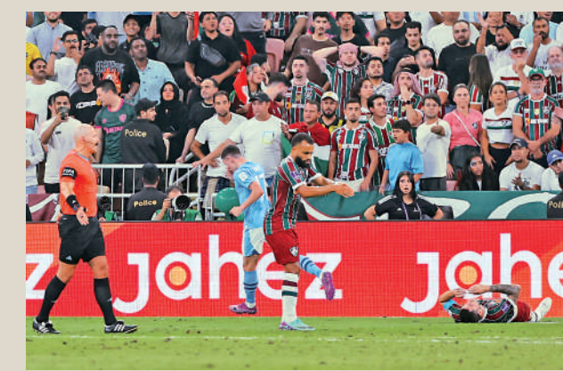
▲連奴（倒地者）攔截變「擺烏龍」，令科頓（右三）間接獲得入球。