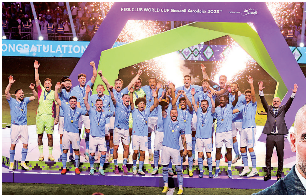
▲曼城挫富明尼斯奪得世冠盃，圖為奪獎慶祝。