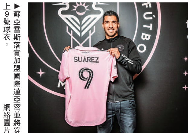
▲蘇亞雷斯落實加盟國際邁亞密9號球衣。

據悉，巍山安置區工程是解決搬遷戶住房安置、受到各級政府高度重視的民生工程，優質高標地完成安置房建設對於改善居民生活環境、維護社會穩定、推進區域經濟發展和城鎮化進程等方面具有重要意義。文：翟懷志（特刊）