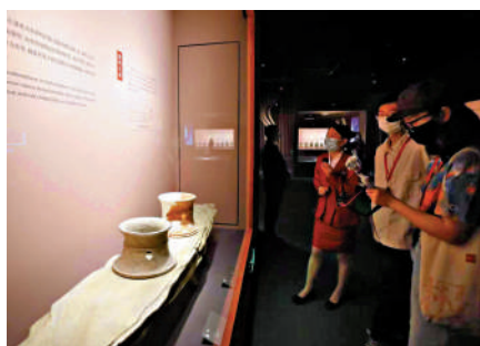
▲觀眾欣賞在中國早期樂器文化展上展出的鼓。

清華大學出土文獻研究與保護中心副教授馬楠表示，《大夫食禮》寫定時間約在戰國中期，可以說彌補了禮書流傳的缺失。《大夫食禮》《大夫食禮記》兩篇禮書編連為一卷，分別有竹簡51支與14支，前者記載大夫食禮中賓主、儐相的行禮儀節，後者