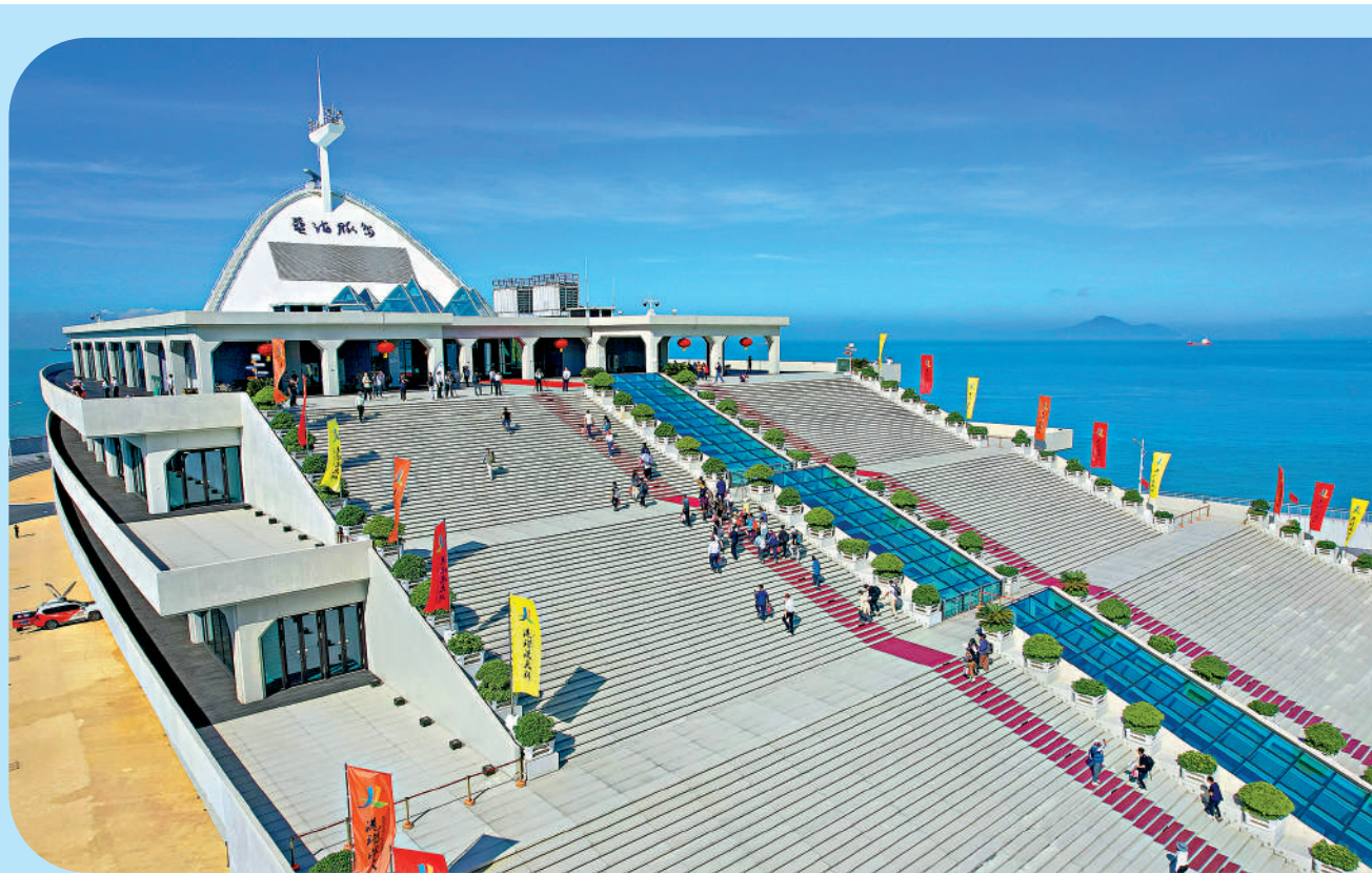
▲聖誕、元旦假期，過萬名遊客追捧港珠澳大橋遊，爭相打卡大灣區世界級景觀。圖為遊客抵達港珠澳大橋東人工島（藍海豚島）。

港珠澳大橋旅遊試運營自12月15日開通以來持續火爆，港澳和內地居民可以經大橋珠海口岸出發，參團乘坐旅遊專巴遊覽大橋及登陸藍海豚島，近距離感受氣貫長虹的「中國跨度」。記者24日從港珠澳大橋遊官方微信公眾號獲悉，大橋遊的旅遊專巴售票即日起至1月7日均已基本「約滿」，覆蓋聖誕、元旦假期，過萬名遊客追捧港珠澳大橋遊，爭相打卡大灣區世界級景觀。而據多家旅行社反映，大橋遊也聯動帶旺港澳遊與珠海遊，「港珠澳2日遊」團至1月上旬收客火熱，有遊客先「大橋遊」再赴港澳過聖誕節。