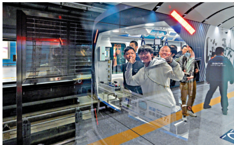
▲自12月8日澳門輕軌媽閣站通車以來，每日吸引大量遊客前去打卡試坐。