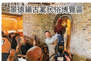
景德鎮古窯民俗博覽區