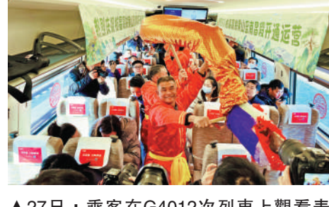
▲27日，乘客在G4012次列車上觀看表演。