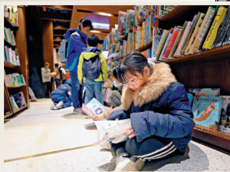
誠品信義店24日熄燈前，讀者專程來到店內看書。

紀欣指出，自民進黨當局上台以來，台灣經濟已經開始走下坡路，加之島內推動的多為短中期閱讀計劃，「頭痛醫頭、腳痛醫腳」，各計劃間缺乏銜接與延續，希望民進黨當局能正視實體書店的困境，畢竟沒有閱讀的地方就是沒有希望的地方。