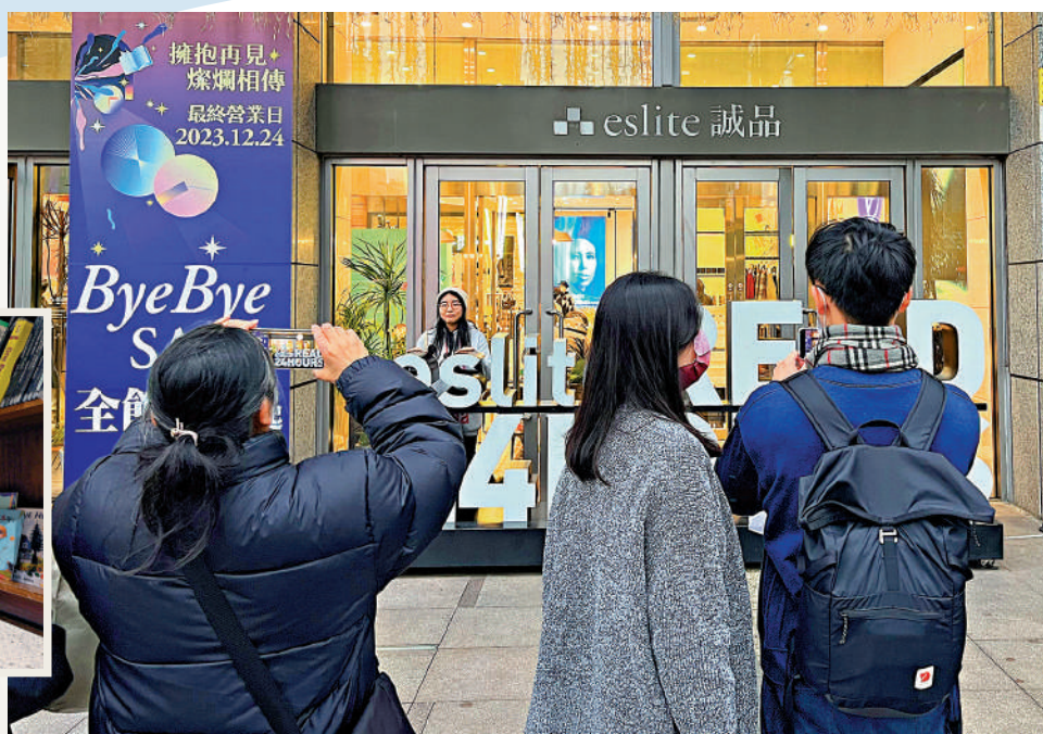
▲12月24日，位於台北市的誠品信義店最後一日營業，吸引民眾前來購書購物、打卡留念。圖為民眾在書店門口拍照留念。