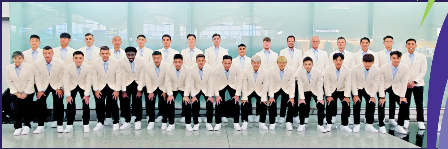
▲港足出發到阿聯酋備戰亞洲盃賽事。