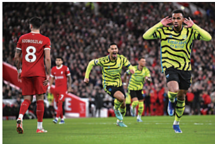
▲阿仙奴上仗賽和利物浦，圖為後衛加比爾(右)入球後慶祝。

出生日期: 1999年1月14日 (24歲) 國籍: 英國 身高: 1米88 位置: 防守中場 球會: 阿仙奴 今季英超表現: 18仗入3球、1助攻