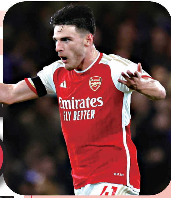
迪格蘭賴斯 小檔案

出生日期: 1999年1月14日 (24歲) 國籍: 英國 身高: 1米88 位置: 防守中場 球會: 阿仙奴 今季英超表現: 18仗入3球、1助攻