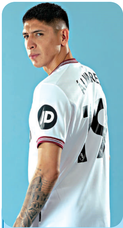
艾臣奧馬艾華利斯 小檔案

出生日期: 1997年10月24日 (26歲) 國籍: 墨西哥 身高: 1米90 位置: 防守中場 球會: 韋斯咸 今季英超表現: 15仗入0球、1助攻