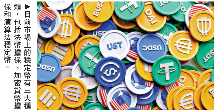
▶目前市場上的穩定幣有三大種類，包括法幣擔保、加密貨幣擔保和演算法穩定幣。

另金管局將會推出「沙盒」安排，向有意願在港發行穩定幣定幣的潛在機構做相關試驗，以傳達相關監管期望及提供指引。不過，「沙盒」只會安排將讓一些將來有意且具備足夠能力的發行人參與，故此規模會很小，金管局目前也未能掌握有什麼發行人有興趣參與。不過，並非每一個牌照申請者都一定要經過「沙盒」階段，「沙盒」安排只是令發行人有一個機會更好了解金管局的監管期望及提供合規指引等。