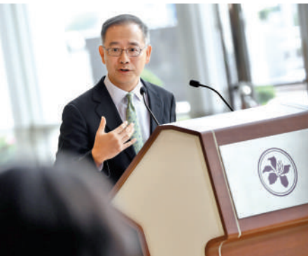
▲余偉文表示，穩定幣有機會成為傳統金融與虛擬資產市場的界面。

鑒於穩定幣所帶來的潛在風險，國際組織包括二十國集團（G20）轄下的金融穩定理事會已明確要求各地應對加密資產相關活動，包括穩定幣發行實施監管。香港金融管理局總裁余偉文表示，