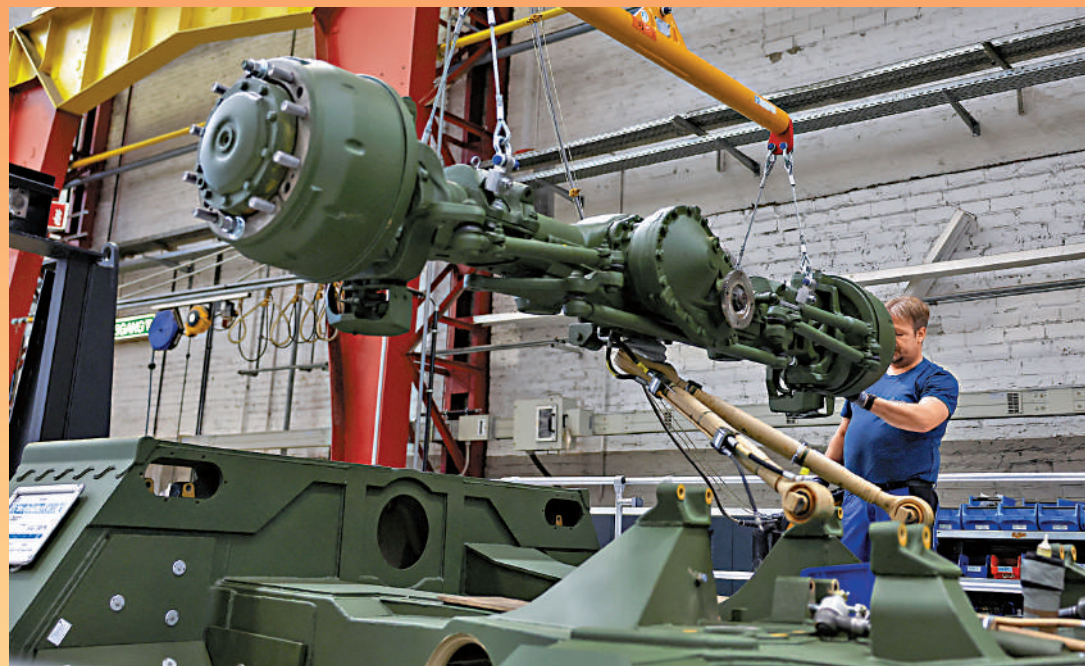
▶工人在德國萊茵金屬工廠內工作。