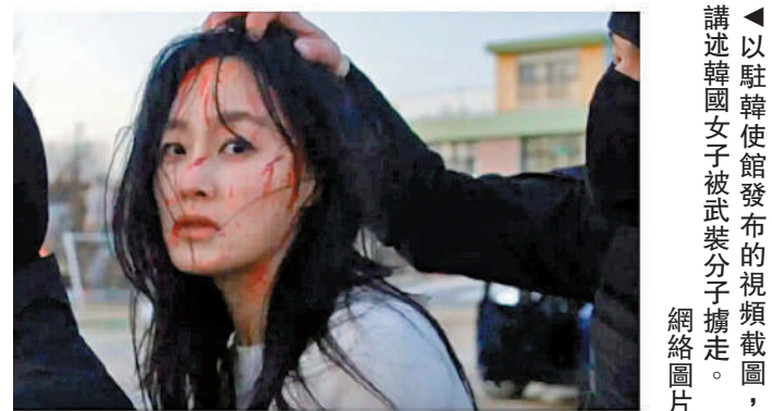
◀以駐韓使館發布的視頻截圖，講述韓國女子被武裝分子擄走。網絡圖片