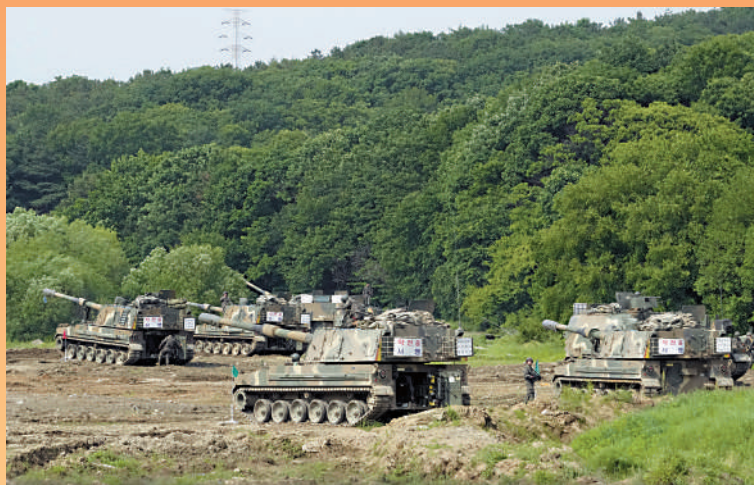
▲韓國將出口大批K-9自行榴彈炮戰車。

【大公報訊】綜合英國《金融時報》、德國之聲網站、路透社報道：俄烏和巴以兩場熱戰相繼開打，軍火市場供不應求，西方國家趁機不斷擴大生產規模，大發戰爭財。英媒對包括美國主要軍火巨頭、英國貝宜系統公司和韓國韓華航空航天公司在內的全球15家防務集團的分析發現，截至2022年底，它們積壓的訂單總額為7776億美元（約6萬億港元），創下新紀錄，遠高於兩年前的7012億美元，今年上半年這一增長趨勢仍持續。