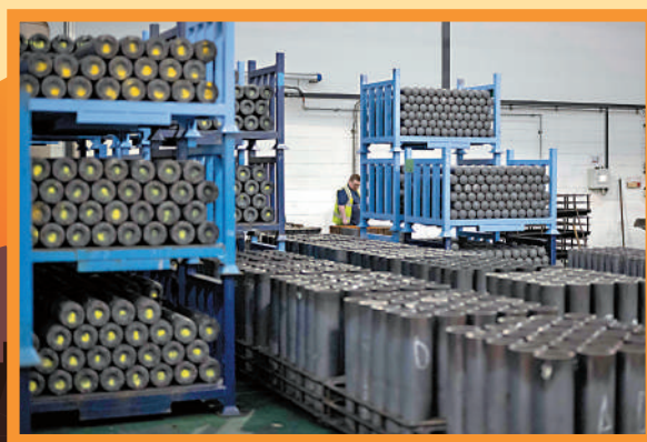
◀工人在英國貝宜系統廠房檢查155毫米口徑炮彈。