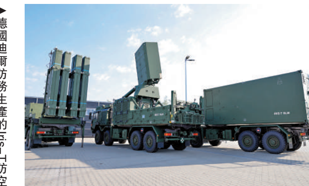
▶德國迪爾防務生產的Iris-T防空系統。

兩母女隨即走到地下室避難，學校其後被炸彈擊中，頭部受傷的母親遭武裝分子綁架。現場只留下她送給女兒的紅色手套。視頻隨即惹來韓方不滿。有批評認為，以方企圖將全面戰爭正當化，並拿朝鮮半島安全借題發揮，十分不妥。另有網民認為，短片內容令人害怕，指以色列做法有失外交禮節。韓聯社引述韓國外交部發言人指，雖然哈馬斯殺害和綁架以色列平民的行為難以開脫，但以方製作及發布有關片段的行為不合適，已經向以色列大使館表明立場。加沙衛生部28日表示，以軍對加沙地帶的襲擊至少已造成21320人死亡、55603人受傷。據統計，加沙地帶已有105名新聞工作者喪生；「保護記者委員會」稱，在第二次世界大戰中殉職的記者約為70人。