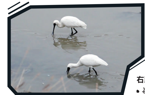
▲早上潮退時，黑臉琵鷺會在排水道徘徊覓食。