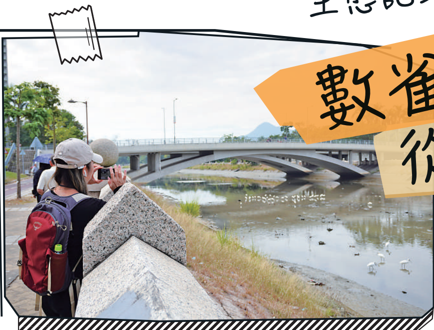
▲天水圍的街坊可以近距離看見黑臉琵鷺。