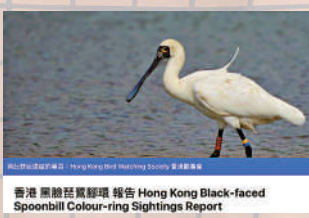
香港黑臉琵鷺標放報告 Hong Kong Black-faced Spoonbill Colour-ring Sightings Report

不同國家、地區的研究人員都會替黑臉琵鷺上腳環，以分辨雀鳥的個體，如申請了身份證般，日後再見都能認出牠是哪一隻，從而知道其壽命、遷徙路線、偏好什麼生境等。市民可以透過電郵或Facebook專頁向香港觀鳥會報告。