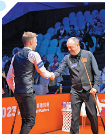
▲威廉斯（右）擊敗卓林普打入決賽。