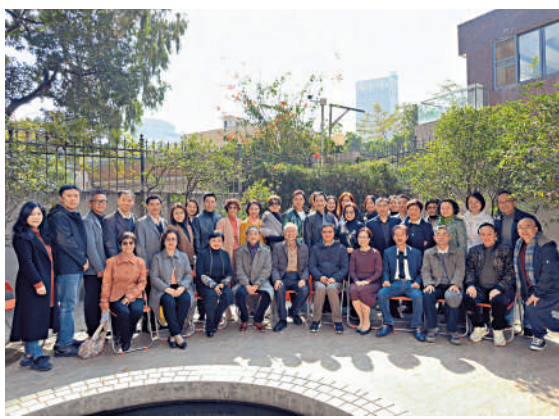
▲紅線女雕像在廣州落成揭幕，圖為現場大合照。