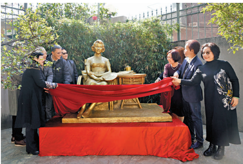
▲嘉賓共同為紅線女雕像揭幕。

馬師曾、紅線女長子馬鼎昌曾在友愛路20號居住過不短的時間，他看見女兒雕像很受觸動，連聲音