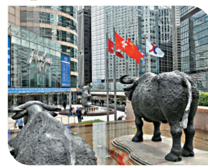
▶在本港設立的有限合夥基金數量於今年8月底首度超越新加坡。

LPF投資種類相當廣泛，包括高端科技、環保、醫療及人工智能(AI)等，在推進粵港澳大灣區金融及戰略性新興產業高質量發展方面擔當重要角色。