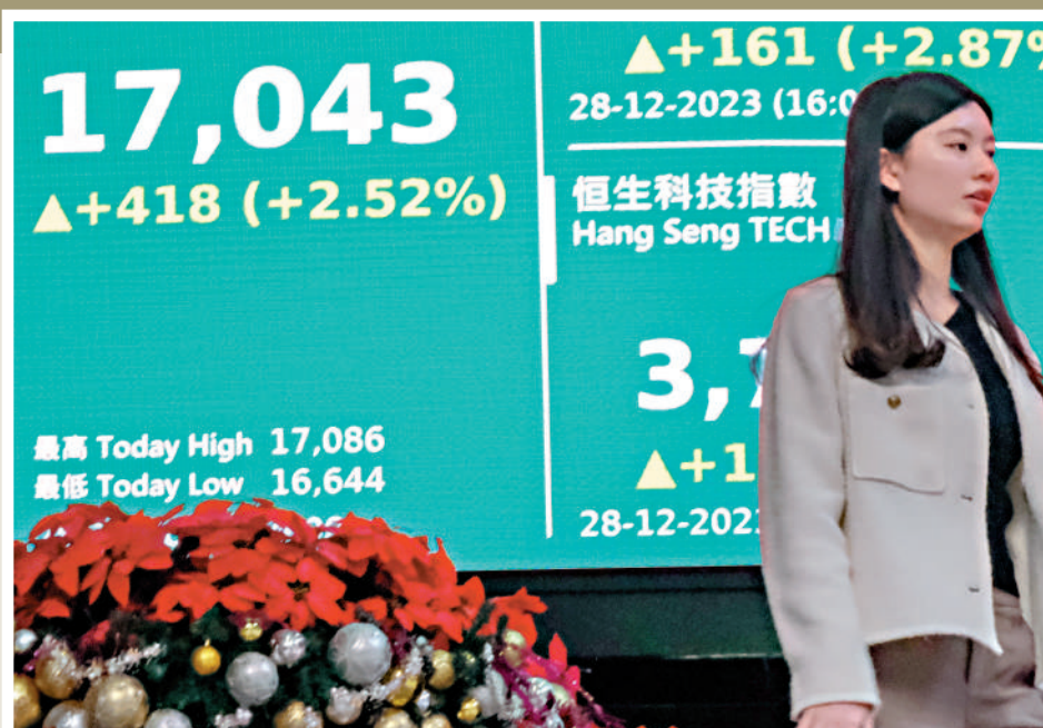
▲受到人民幣匯價飆高及A股上升刺激，帶動恒指昨日重上萬七關。

港股期指結算日，藍籌殘股大翻身。受到人民幣匯價飆高及A股上升刺激，帶動恒指昨日重上萬七關，全日升418點。今年股價深度調整的藍籌股，在平倉盤推高下，昨日表現突出。碧桂園服務(06098)股價升7.4%，是升幅最大藍籌股，但今年累跌65%。今年藍籌股股價表現最差的李寧(02331)，昨日大升6.1%。 證券界人士認為，港股升市或由對沖基金平倉所推動，所以難言大市有轉勢跡象，除非恒指能夠在18000點企穩數周，投資者現階段毋須急於入市撈底。