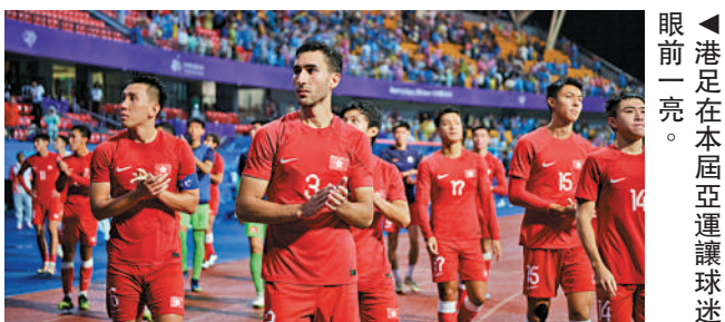
▲港足在本屆亞運讓球迷眼前一亮。

4 港隊在本屆亞運讓香港球迷眼前一亮。因同組的阿富汗和敘利亞退賽，港足獲得直接晉級16強資格。港足在16強以1：0勝巴勒斯坦，8強以1：0爆冷戰勝亞洲「二哥」伊朗更掀起全城熱話，並且歷史性打入亞運4強。雖然在準決賽和銅牌戰分別不敵日本及烏茲別克斯坦，但球員的表現已獲球迷激讚。