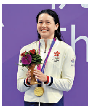
▲何詩蓓時隔9年再戰亞運。

2 何詩蓓時隔9年後再度出戰亞運，這名港產世界級泳手在杭州亞運狀態勇銳，在個人強項的女子100米和200米自由泳中毫無懸念強勢摘金，50米自由泳則獲得銀牌，並在50米蛙泳、4×100米混合泳接力和4×100米自由泳接力中取得銅牌，個人勇奪2金1銀3銅，成為港隊在本屆亞運奪得最多個人獎牌的選手。