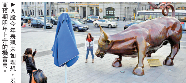
商預期明年上升的機會高。券

有「商品大王」之稱的羅傑斯也對美股前景持悲觀態度。他認為資產價格將暴跌，經濟災難將來臨，現在已明顯看到美國的債市和房地產出現泡沫，股市也醞釀泡沫，今年美股只靠幾隻大型科技股推動升勢，這是即將崩盤的徵兆，他更計劃適時沽空特斯拉和英偉達等「明星股」。他建議投資者應持有貴金屬，因為在恐慌時期，貴金屬比其他資產更保值。