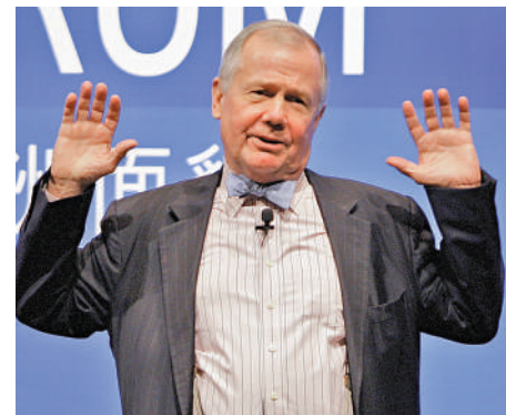
▲羅傑斯建議，明年投資者持有貴金屬，因在恐慌時期比其他資產保值。

幣政策，甚至有大幅減息的可能，料到2025年上半年聯邦基金利率將降至1.25厘。但減息不會成為利好因素，因為代表經濟衰退不斷惡化。