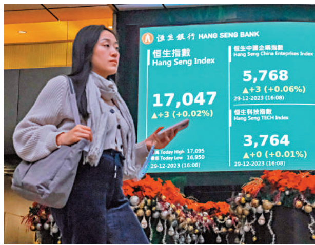
3點收市。港股在2023年收爐日窄幅上落，僅微升3點收市。中新社