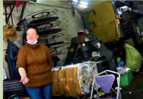
▲土瓜灣浙江街一間環保回收店的老闆透露，回收品大多送到碼頭上船，但不清楚會送到哪裏。