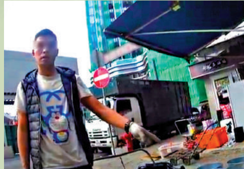
▲大角咀嘉善街的環保回收店店員表明不收玻璃。