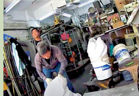
▲土瓜灣炮仗街環保回收店的老闆說，所有回收品都會再看一下，盡量做到垃圾分類。