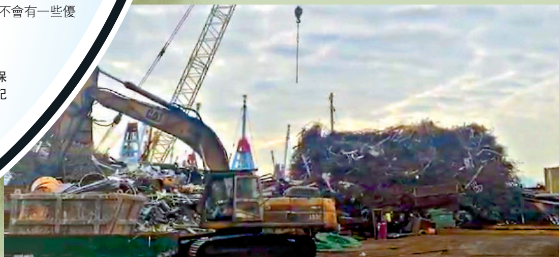
▲大角咀新油麻地公眾貨物起卸區堆積了一座廢鐵山，等候壓縮運往外地。