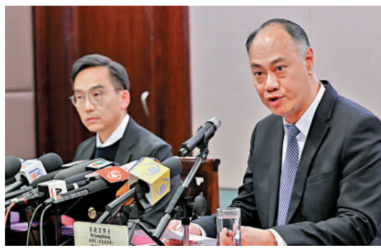
▲懲教署對鍾翰林違反監管令竄逃至英國嚴厲譴責，並發出召回令，同時聯絡其他執法部門依法通緝鍾翰林。