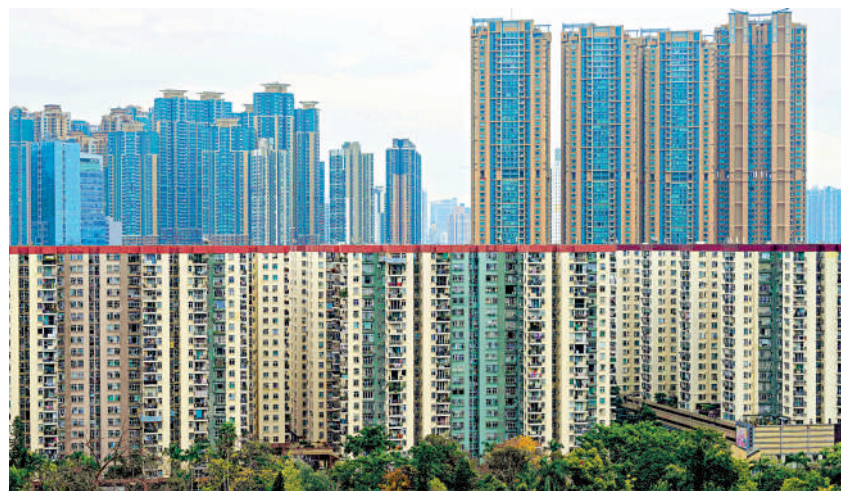
◀隨著樓價回落，不少人士轉租為買，亦有投資者趁低吸納收租單位。

而特區政府搶人才計劃將會逐步增加本地住屋需求，今年在通關、外來人才計劃及買家觀望轉買為租等因素下，租務相當暢旺，樓價跌但租金升的情況下，租金回報亦升至逾6年新高，市場預期租金回報將攀升至3厘水平。在這個走勢下，加上特區政府為外來人才推出置業印花稅「先免後徵」安排，最近有不少人士已趁樓價低水轉租為買，亦有長線投資者趁低吸納收租單位。這些投資者亦有將資金存放在定存戶口收息，但他們認為，定存息率總會隨着息率周期變化已回落，但「磚頭」趁低吸納的機會卻並非時常出現。當利好因素於未來逐步增多，當越多人已認為樓市轉勢之時，當刻樓價往往早已反彈。