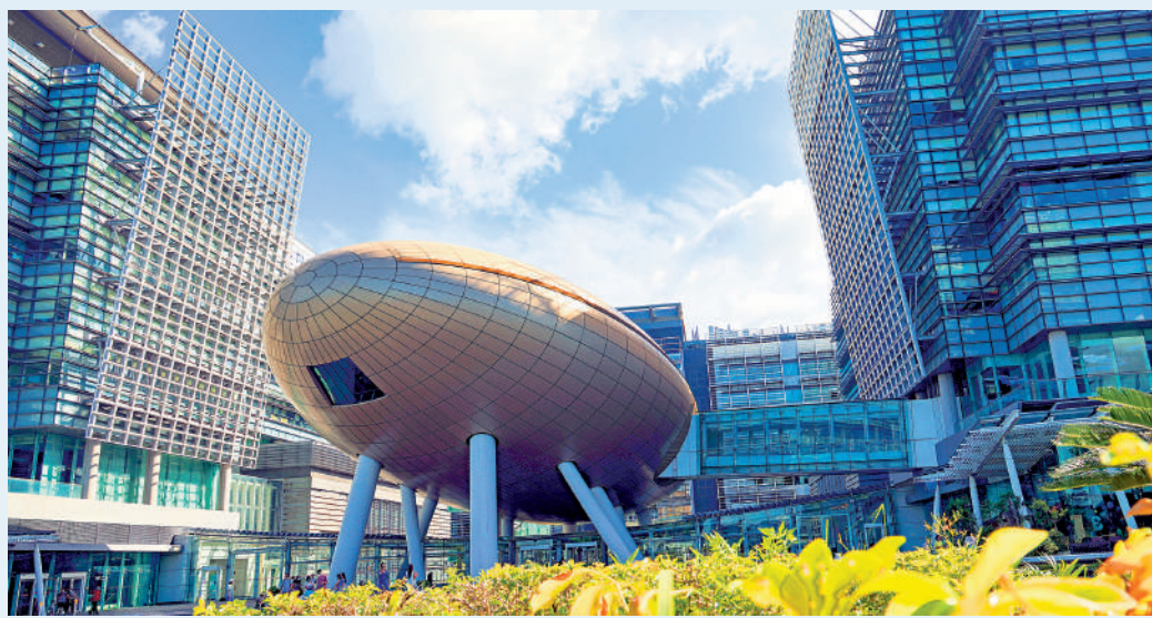
▲面對全球科技創新的競爭，資本與人才的引入對於推動香港創科產業的發展至關重要。

香港向來以開放的經濟體系和法治社會聞名於世。近年來，特區政府積極配合國家發展大局，致力於將香港打造成國際創新科技中心。本文旨在探討香港如何在2024年通過在社會全面加强創新科技發展，並推動人工智能科技應用，進一步與國家發展方向協同的同時，與大灣區其他城市共同打造國際級科技創新樞紐。