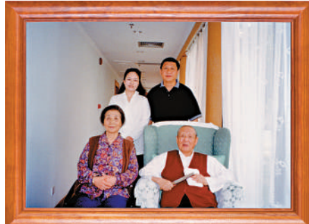
孝老愛親 這是習近平夫婦同父親習仲勳、母親齊心的合影。這張照片第一次出現在他的書架上。