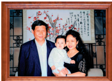
家庭幸福 這是習近平一家三口的合影。這張照片也是第一次出現在他的書架上。