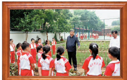
最深牽掛 2023年5月31日，習近平來到北京育英學校看望慰問師生，向全國廣大少年兒童祝賀「六一」國際兒童節快樂。