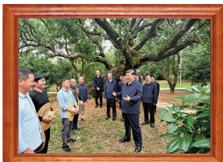
人民情懷 2023年4月11日，習近平總書記來到廣東茂名高州市根子鎮柏橋村荔枝種植園，了解當地發展特色種植產業和文旅產業等情況。