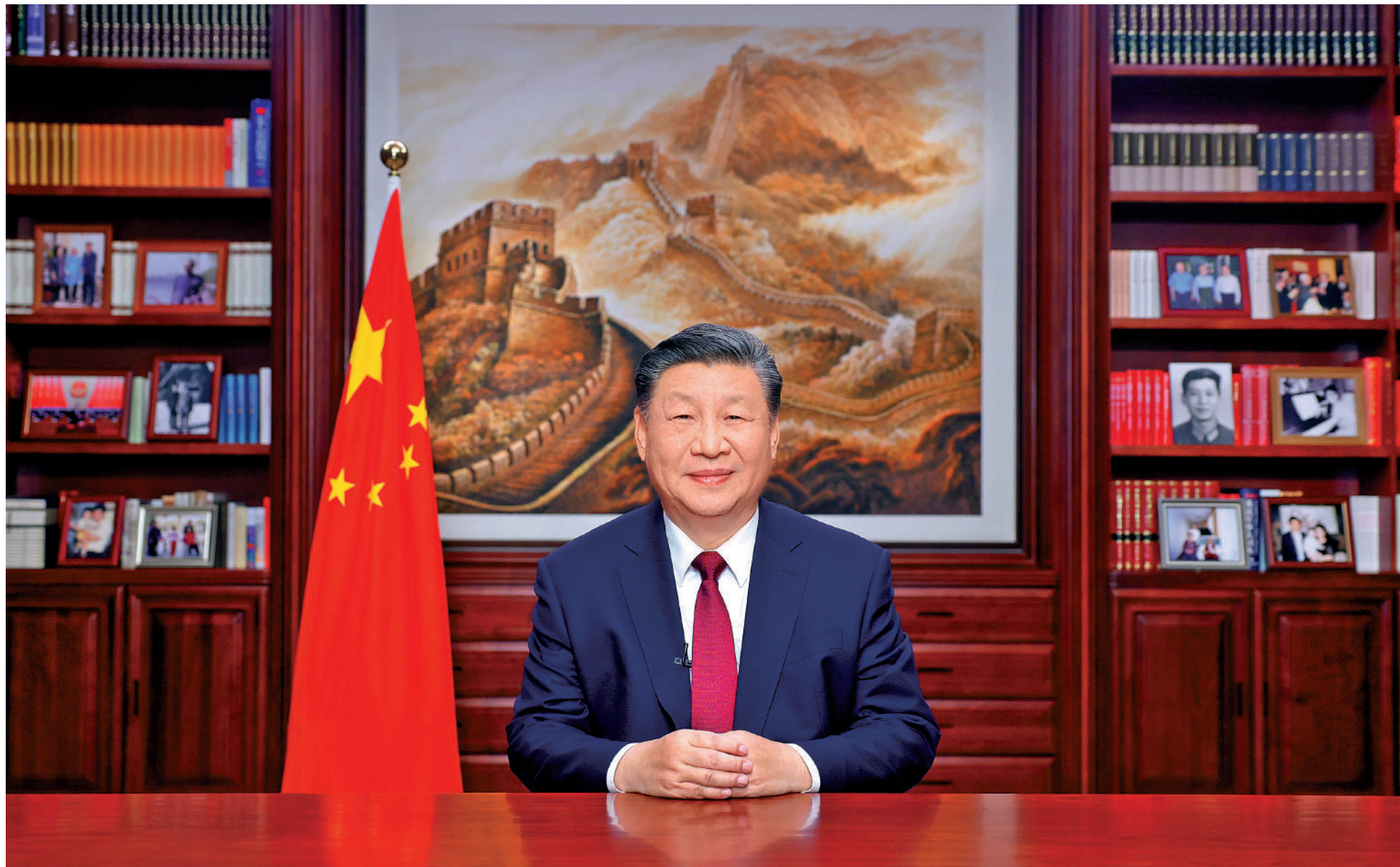
▲2023年12月31日，國家主席習近平通過中央廣播電視總台和互聯網，發表二〇二四年新年賀詞。