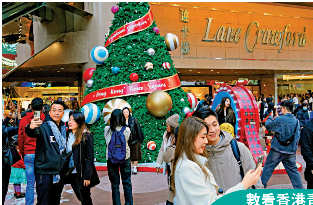
▲民青局昨日推出「青年儀表板」，整合大量與青年相關數據，有助制訂政策。

民青局於2022年底公布《青年發展藍圖》(《藍圖》)，當中提出會推出「儀表板」，整合青年相關數據和趨勢，以更好把握青年脈搏，推動青年發展工作。民青局隨即展開「儀表板」的籌備工作，收集由各相關政策局及部門分別備存的資料，並整合涵蓋多個與青年範疇有關的數據。為了方便用戶瀏覽，「儀表板」加入了互動數據圖表，讓用戶可靈活揀選「儀表板」上顯示的資訊或不同的數據組合。「儀表板」已上載至《藍圖》的專屬網站。「儀表板」的數據和資訊會定期更新，以反映與青年有關的最新情況及趨勢。