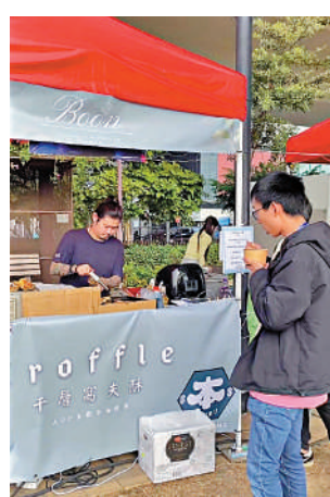
▲觀塘海濱花園過去兩日舉辦「炒旺香港」市集。

「GP49」昨晚表示，已全面解決供電問題，有電力師傅駐場，並安排發電車到場，為耗電量較大的熟食檔獨立提供電力。「GP49」說，已竭力做好電力準備，可惜仍有數個攤檔供電不穩，是始料不及。