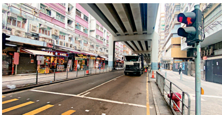
▲離意外現場不遠便有行人過路設施。

陳太說，土瓜灣區有不少長者居住，平日見排隊領取飯盒的長者無家人陪同，不知他們是不是獨居長者。