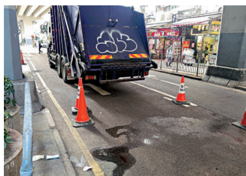
▲意外現場遺下血漬。