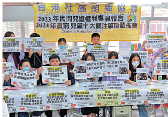
▲社協發表報告，指房屋問題連續13年成為貧窮兒童最關注的政策。

【大公報訊】記者賴振雄報道：兒童是社會未來的棟樑，社區組織協會昨日發表「年度民間兒童權利專員報告」，房屋問題連續13年成為貧窮兒童最關注的政策，位列關注議題的第一位，其餘關注政策包括：醫療服務欠妥善、貧富懸殊問題嚴重、新移民學童及家庭面對歧視等。