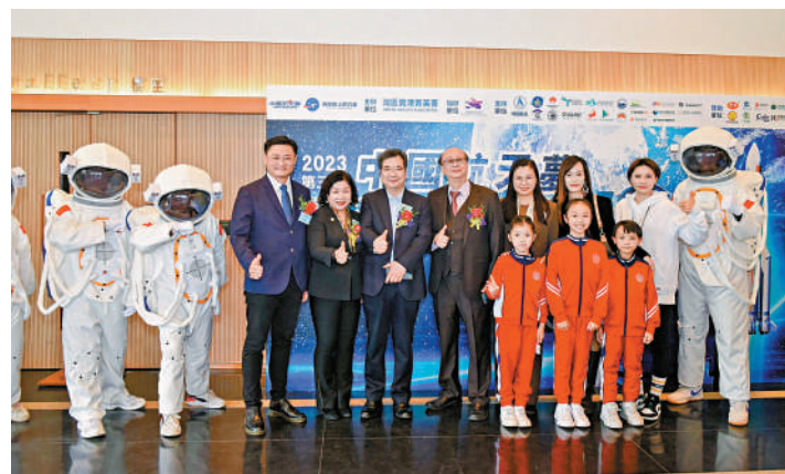
▲中國航天夢2023第三屆徵文比賽頒獎禮日前圓滿舉辦。