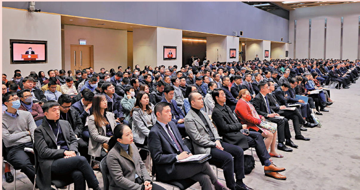
除了地區治理培訓班，全體候任區議員上月22日出席全國港澳研究會成立十周年慶祝大會的直播，聆聽國務院港澳辦主任夏寶龍的致辭。