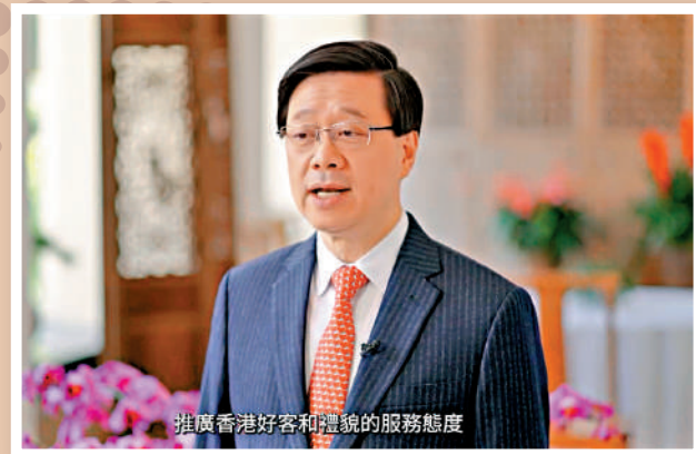
推廣香港好客和禮貌的服務態度

大除夕夜，維港兩岸有近48萬名市民和旅客欣賞煙花。入境處數據顯示，12月30日、31日共有逾42.2萬訪港旅客人次，82%是內地旅客，單是大除夕，有近20萬內地旅客來港，連同來自其他地方的旅客，當日有超過22.7萬旅客人次來港。