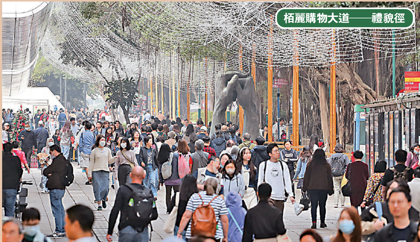
栢麗購物大道——禮貌徑