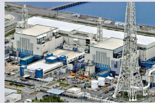
位於日本新潟縣的柏崎刈羽核電站6號機組(右)和7號機組。

受地震影響，北陸電力公司表示，目前已知石川縣內共有3.6萬戶停電。在新潟市中心則發現土壤液化現象，有下水管道破裂，導致多戶停水。此外，受地震影響，包括NTT Docomo、KDDI、Softbank、樂天等多家手機業者在當地的通訊受阻。石川縣也有部分地區出現通訊故障。同時，強震讓東北、北陸及上越新幹線一度停運，部分線路後續得到了恢復。此外，有5條高速公路禁止通行，上越、北陸新幹線停運，能登機場關閉。