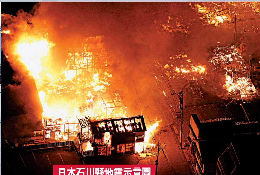
輪島市一處房屋起火。