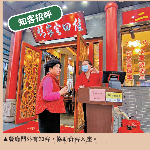
▲服務員站在一旁，隨時為客人提供服務。