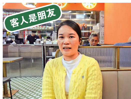
▲黃小姐在福田開設茶餐廳，她指成功秘訣是「將客人當朋友和家人一樣看待」。