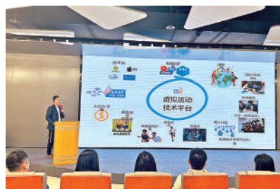
▲恢復通關後，港澳投資企業加速進入廣東。圖為香港創客在粵路演。

東省市場監督管理局二級巡視員龔憲平介紹，在大力推進粵港澳市場軟聯通方面，廣東加快粵港澳大灣區市場監管領域規則銜接、機制對接，深化登記確認制改革，推行登記註冊「灣區通辦」，施行「跨境通辦、一地兩注」，試點香港投資者簡化版公證文書電子化流轉，實現港資企業全程電子化登記，便利灣區投資興業。截至目前，大灣區內地九市每千人擁有企業87戶，達到發達國家水平。另外，廣東進一步深化灣區標準、灣區認證，推動省政府與國家知識產權局啟動新一輪局省共建，推進建設國際一流灣區知識產權強省。