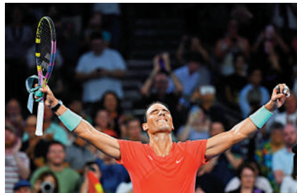
▲拿度傷愈復出即勝，興奮慶祝。

年是自己網球生涯最艱難的一年，很高興今年能夠復出，並打出自己認為高水平的比賽。他認為本季仍很大可能是個人最後一個球季，但如果身體狀況良好，不排除會繼續比賽的可能性。