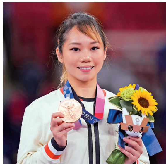
▲劉慕裳是東京奧運銅牌得主。