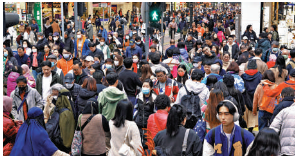
受惠旅遊業復甦，本港11月份零售銷貨值上升15.9%。

【大公報訊】記者鍾佩欣報道：受惠於全面通關後旅遊業恢復，11月份零售業銷貨值升15.9%，連升12個月。香港零售管理協會表示，12月份聖誕期間，珠寶、鐘錶等旅遊相關行業按年錄得升幅，惟