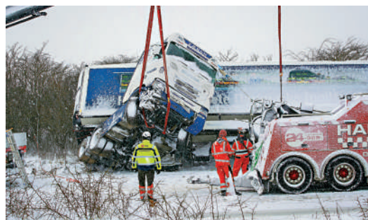
▲救援人員3日在丹麥日德蘭半島的維堡，試圖打撈一輛在大雪中滑出路面的卡車。