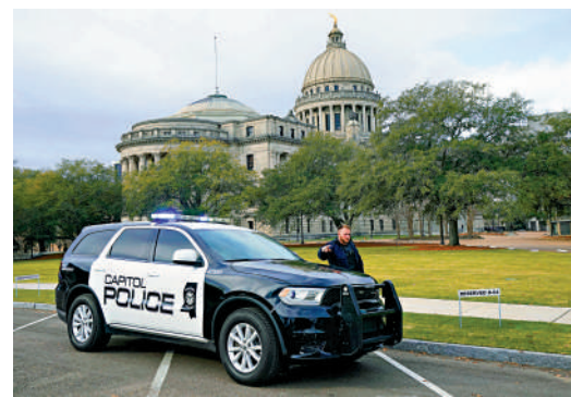
▲一名國會警察3日在密西西比州議會大廈，調查炸彈威脅事件。

此前，在去年聖誕節期間，不少美政界人士收到假報警電話騷擾，包括佐治亞州共和黨眾議員格林、紐約州共和黨聯邦眾議員威爾斯、佛州參議員斯科特等人。