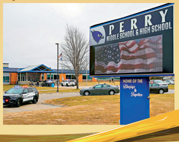
▼警車4日停在佩里中學和高中校舍外。路透社

另外，與很多其他州不同的是，艾奧瓦州提名選舉採用「黨團會議」（Caucus）制度，也就是由基層黨團辯論之後選出候選人，而與直接統計每個投票人選票的基層初選（Primary）不同。共和黨首場2024年黨內初選1月15日在艾奧瓦州舉行。來源：BBC