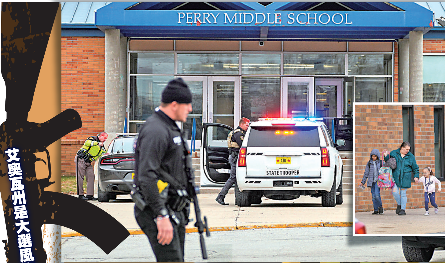
▲美國執法人員4日在佩里中學處理槍案現場。