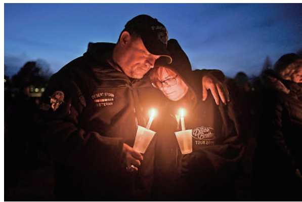
▲當地民眾4日為槍擊案受害者舉行守夜活動。

【大公報訊】綜合CNN、美聯社報導：當地時間4日，美國艾奧瓦州一間中學發生槍擊案，造成包括槍手在內的2人死亡，另有5人受傷。槍手是該校一名17歲學生，作案後開槍自殺身亡，警方目前暫未宣布其作案動機。這是2024年伊始美國發生的第二起校園槍擊事件，槍支暴力再次受到關注。