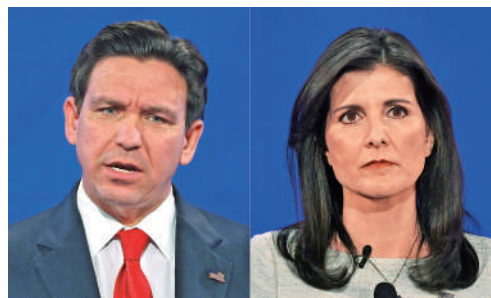
▲共和黨大選候選人德桑蒂斯（左）和黑莉（右）。

白宮新聞秘書讓一皮埃爾當天呼籲國會通過立法應對槍支暴力，稱總統拜登正在跟進事件進展。