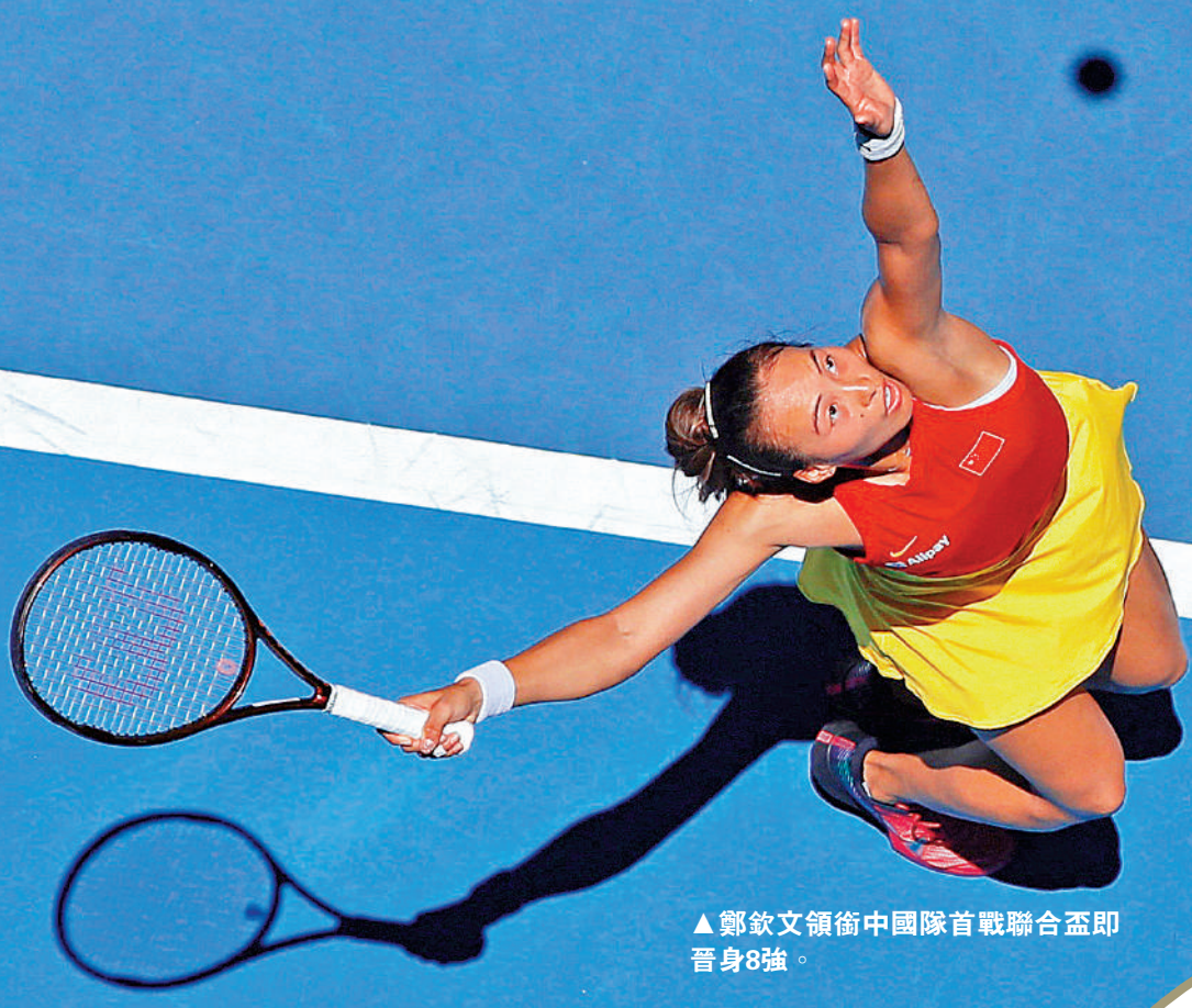
▲鄭欽文領銜中國隊首戰聯合盃即晉身8強。