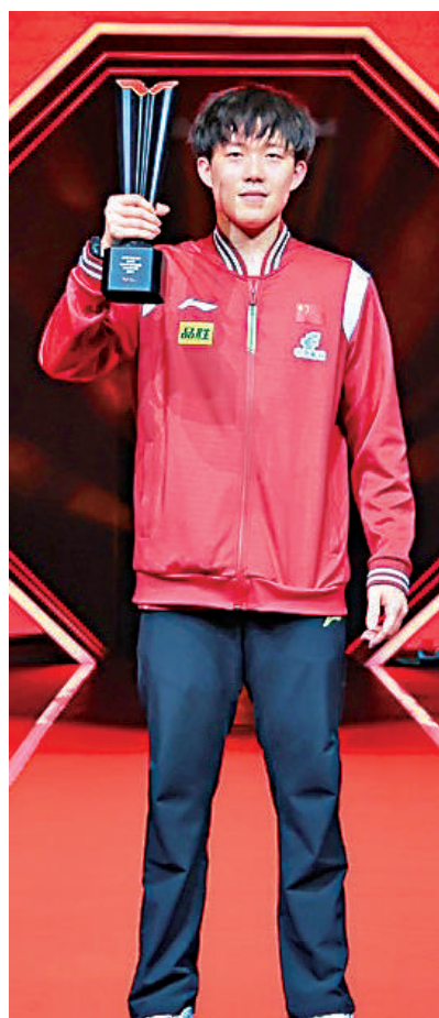
▲王楚欽高舉WTT男乒總決賽冠軍獎盃。

【大公報訊】據中新社報道：2023年世界乒乓球職業大聯盟（WTT）男子總決賽在卡塔爾多哈落下帷幕。中國選手王楚欽以4：0戰勝隊友樊振東成為男單冠軍。中國「00後」男雙組合袁勵岑／向鵬以3：0擊敗隊友林高遠／林詩棟奪冠。