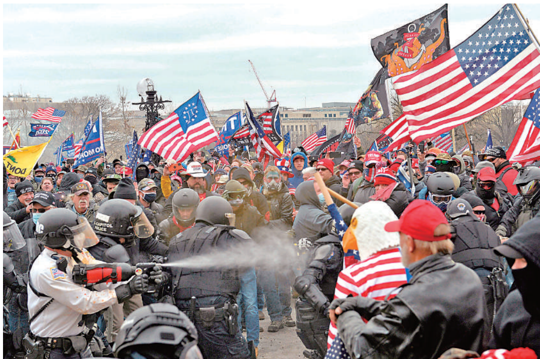
▲2021年1月6日，特朗普的支持者暴力闖入美國國會大廈，並與警察和安全部隊發生衝突。

美媒認為，聯邦最高法院介入此事，可能將會把大法官們置於一個「關鍵的、令人不安的」位置，這讓人想起美國最高法院介入2000年大選的那件往事。當時，美國最高法院裁定小布什勝選，進一步加劇美國兩極分化。美國阿默斯特學院法理學和政治學教授薩拉特表示，各州在特朗普參選資格問題上做出完全相反的判決，加劇了美國政治的「混亂和戲劇性」，同時進一步削弱了美國公民對美國民主的信心。