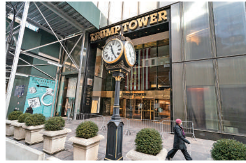
▲位於紐約曼哈頓的特朗普大廈。

在此案庭審前，恩格隆就裁定詹樂震的辦公室已經出示了「確鑿證據」，證明特朗普在2014年至2021年期間在財務文件上虛報了8.12億至22億美元的淨資產。特朗普多次稱恩格隆「精神錯亂」，又指責身為非裔的詹樂震是「種族主義者」、「徹底腐敗」。他堅稱自己「沒有做錯任何事」，「我的財務報表做得很棒，這個案子根本不該成立」。