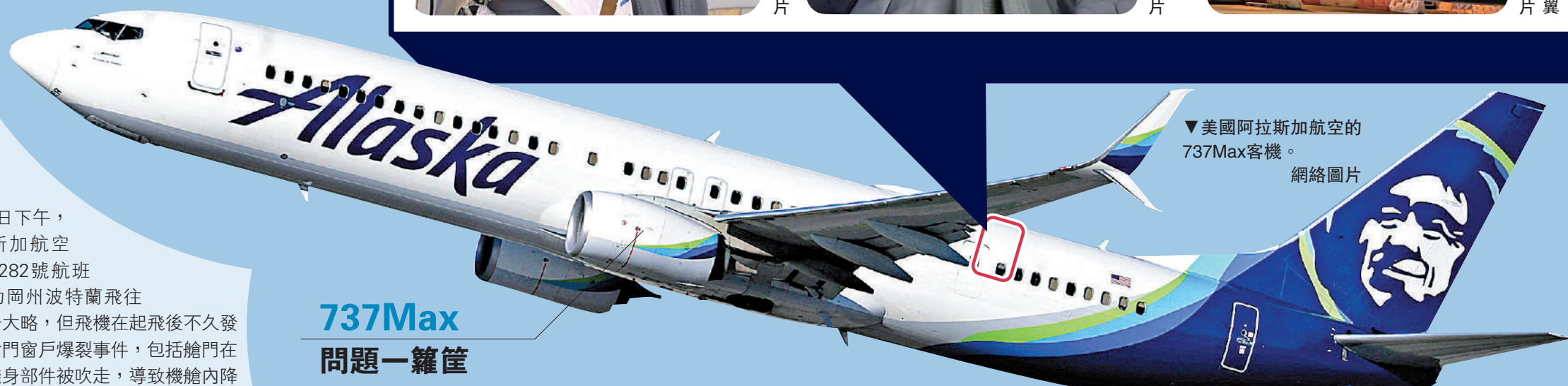
美國阿拉斯加航空的737Max客機。