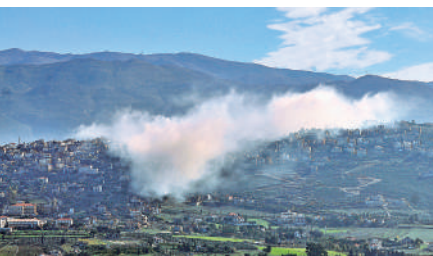
黎巴嫩靠近以色列邊境的一個村莊上方冒起白煙，疑似遭到以軍空襲。

美國國務卿布林肯周六抵達土耳其，與土耳其外長舉行會談，展開新一輪外交行動。但評論指出，儘管布林肯和其他高級外交官數次前往該地區，但衝突仍未緩解。