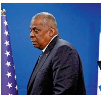
美國國防部長奧斯汀因手術併發症需要住院。

五角大樓稱，國防部副部長希克斯隨時做好準備，在必要時代表行使職權，但沒有透露具體詳情。萊德表示，奧斯汀知悉巴格達空襲事件，並說奧斯汀與拜登先前授權這項行動。