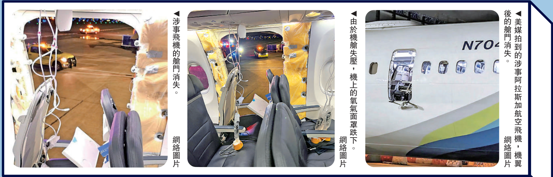
涉事飛機的艙門消失。

【大公報訊】綜合美聯社、CNN、路透社報道：美國阿拉斯加航空公司(Alaska Airlines)一架波音737Max 9機型客機，5日起飛不久在空中發生事故，突然有一扇艙門被吹落，最後緊急迫降返回起飛的機場，未造成人員傷亡。在事故發生後，阿拉斯加航空公司宣布將停飛該公司所有同型號飛機。