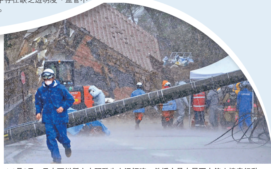
1月6日，日本石川縣穴水町發生山泥傾瀉，救援人員在暴雨中停止搜索行動。

五角大樓新聞協會批評了國防部的保密做法，稱美國公眾對於國家最高國安官員的健康狀況和決策能力擁有知情權，即使是美國總統，因為醫療程序需要委託副總統履職時也會及時披露。