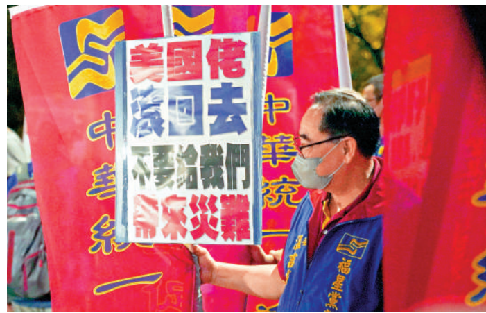
▲台灣民眾舉行集會，批評美國干涉台灣問題。資料圖片