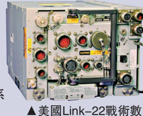
▲美國Link-22戰術數據鏈系統

中國業務： 2021年11月，ViaSat宣布與中國衛通集團股份有限公司合作，在中國建成移動衛星網絡。ViaSat還曾獲得中國民用航空局頒發的補充型號合格認定，可在空中客車A320系列飛機上安裝Ka波段衛星系統。