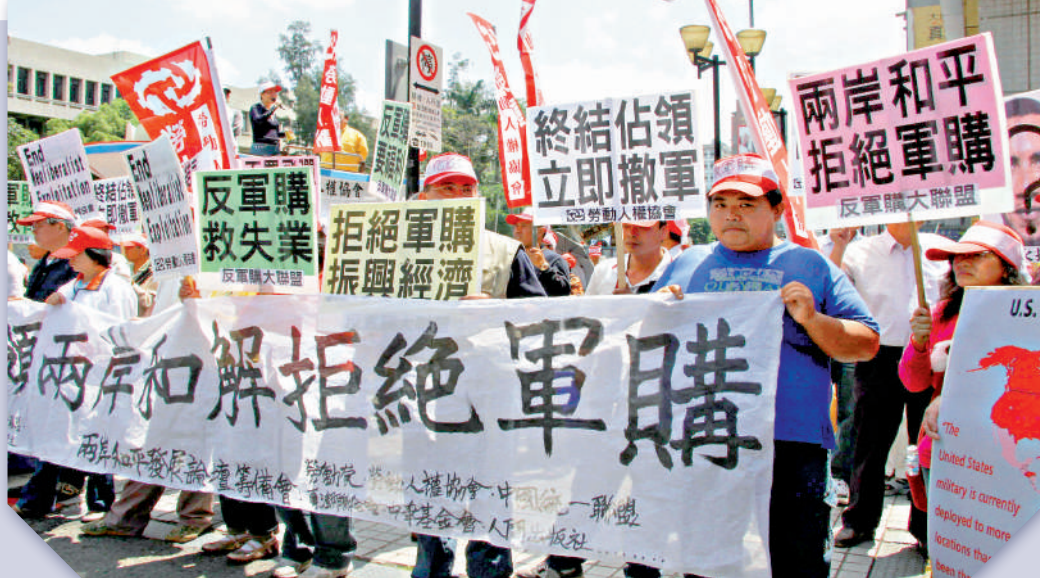
▲台灣民間團體舉行集會，批評台當局向美國購買武器，破壞兩岸關係及台海和平。資料圖片