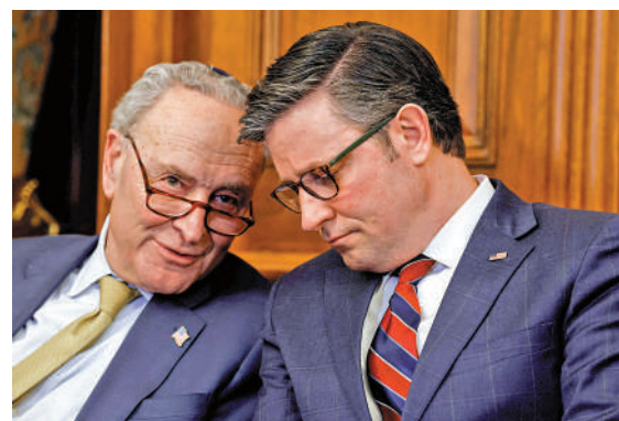
▲美國參議院多數黨領袖舒默（左）和眾議院議長約翰遜。

「讓所有人都滿意」。眾議院極右團體「自由核心小組」表示，該協議「比想像的還要糟」，堪稱「徹底失敗」。令右翼政客特別不滿的是，該協議似乎不包括任何額外資金用於應對他們一直強調的非法移民問題。