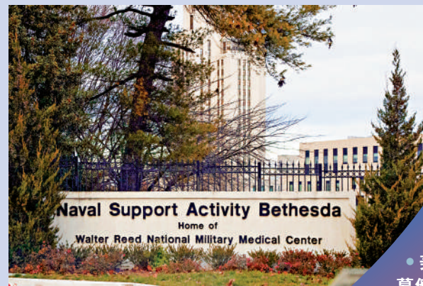
▲奧斯汀入住的里德國家軍事醫療中心。