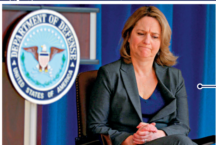
▲國防部副部長希克斯2日被安排接手奧斯汀部分職責時，對其住院一事一無所知。

去年12月22日，現年70歲的奧斯汀在里德國家軍事醫療中心接受了一次病情尚未公開的手術，並於次日回家。今年1月1日，他突發「劇烈疼痛」，當天被再次送進里德國家軍事醫療中心。按照五角大樓的說法，由於醫療需求，醫院一開始就讓奧斯汀入住ICU，確保能立即進行治療，後續出於院方空間及隱私考量，仍讓奧斯汀續住ICU。