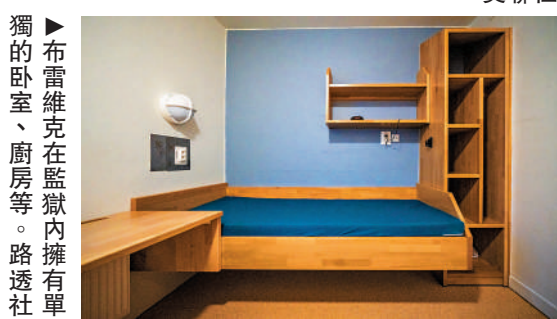
▲布雷維克在監獄內擁有單獨的臥室、廚房等。