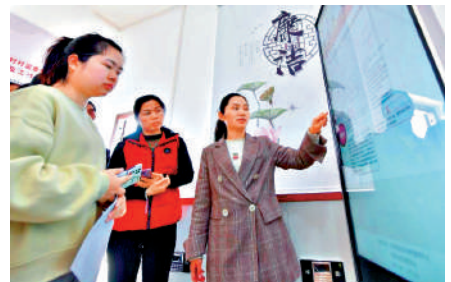
▲在廣西鹿寨縣鹿寨鎮波井村政務服務中心，村民學習使用「廉情驛站」。

李希在主持會議時指出，習近平總書記發表的重要講話，總結了全面從嚴治黨的新進展、新成效，深刻闡述黨的自我革命的重要思想，科學回答我們黨為什麼要自我革命、為什麼能自我革命、怎樣推進自我革命等重大問題，明確提出「九個以」的實踐要求，對持續發力、縱深推進反腐鬥爭作出戰略部署。講話高瞻遠矚、視野宏闊、思想深邃、內涵豐富，是新時代新征程深入推進全面從嚴治黨、黨風廉政建設和反腐敗鬥爭的根本遵循。要深入學習貫徹習近平總書記重要講話精神和習近平總書記關於黨的自我革命的重要思想，堅定擁護「兩個確立」、堅決做到「兩個維護」，縱深推進全面從嚴治黨、黨的自我革命，為以中國式現代化全面推進強國建設、民族復興偉業提供堅強保障。