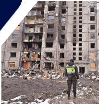
▶基輔多處民宅遭俄軍空襲。

今年全球多國將迎來選舉，約40億人參加投票。不同組織及個人預計在選舉中利用AI煽動分裂，製造大規模政治混亂。在分裂的西方社會，依賴從社交媒體獲取信息的選民容易被操控。