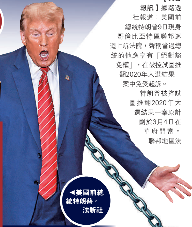
◀美國前總統特朗普。