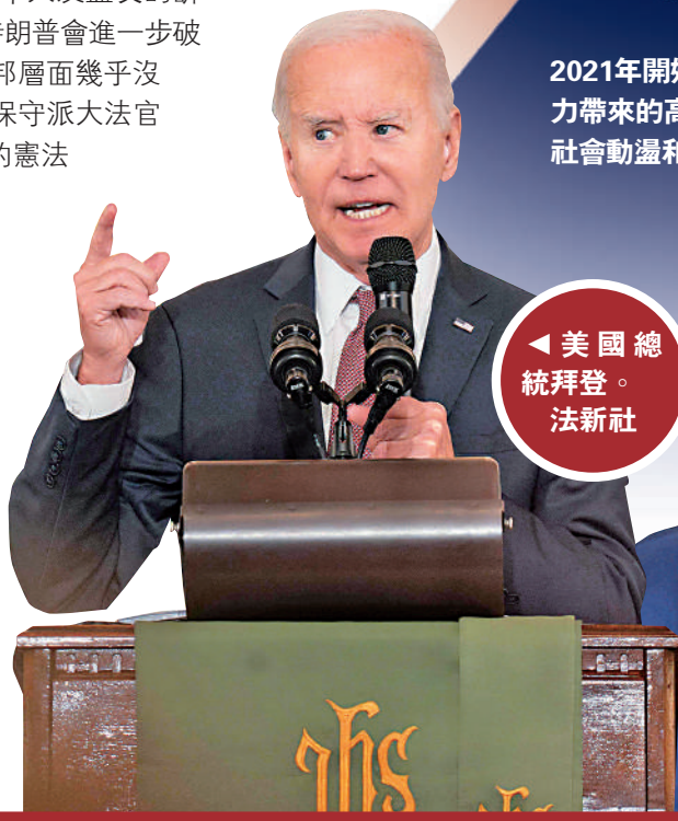
◀美國總統拜登。

2021年開始的全球高通脹浪潮恐持續下去。為應對通脹壓力帶來的高利率將拖累全球經濟增長，增加金融壓力、社會動盪和政治不穩定的風險。歐亞集團網站