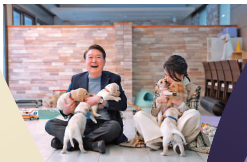
▲韓國總統尹錫悅和夫人都是寵物愛好者。圖為其在一間導盲犬學校與犬隻互動。

據韓國農業部估計，截至2022年4月，韓國約有1100個狗廠，飼養着57萬隻狗，為約1600家餐廳提供狗肉。韓國食用狗協會則表示，實際受到狗肉禁令衝擊的數字遠高於官方統計，