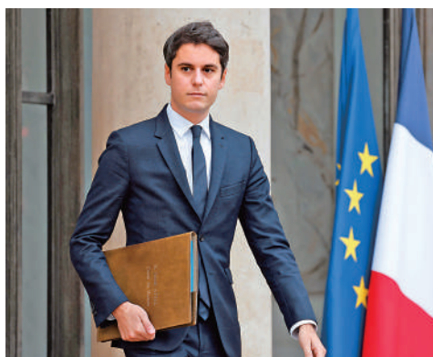
▲34歲的法國教育和青年部長阿塔爾接任總理。法新社

這任新任總理最迫切的任務，是確保馬克龍的中間派力量戰勝極右翼，首先是今年6月的歐洲議會選舉，然後是2027年的總統選舉。阿塔爾比前任法國總理菲利普更被看好成為馬克龍的接班人。預計法國將在本周進行更廣泛的內閣改組。