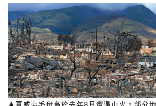
▲夏威夷毛伊島於去年8月遭遇山火，部分地區幾乎化為灰燼。

受氣候暖化影響，去年全球多地遭遇極端天氣災害：致命熱浪襲擊歐洲；加拿大經歷了有史以來最嚴重的山火季節；夏威夷毛伊島遭遇百年一遇的山火等等。美國國家環境資訊中心的數據顯示，去年美國遭受了至少25起氣候和天氣災害，損失超過10億美元。