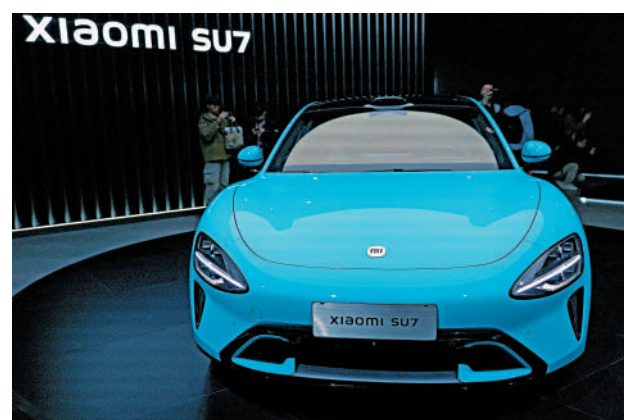
▲小米SU7可能是目前中國市場上擁有最大前備箱的純電轎車。

小米第一架汽車名為SU7，市傳小米後續還有增程車型，有網民期待會有SU5。小米汽車表示，目前聚焦在摩德納平台的首車SU7，強調「決心10倍投入、認真真造一輛好車，並打磨到極致」，目前沒有SU5，甚至在未來數年也沒有增程車型。