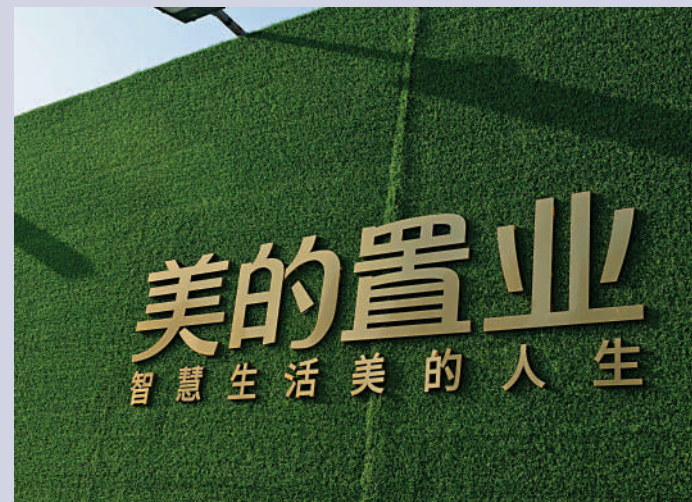
▲交易完成後，美的置業將間接持有寧波美睿的全部股權。