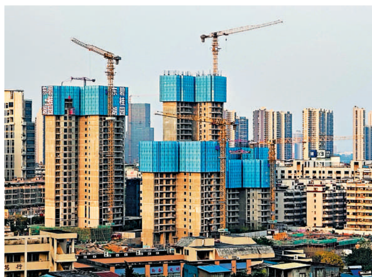
▲近期不少內房企都以出售資產來籌集資金還債。

近期打算出售資產償債的不止合景泰富一家房企。去年8月出險的碧桂園據報導出售澳洲悉尼Wilton Greens等停滯不前的海外項目，以籌措資金兌付債項；世茂集團傳出售位於西澳大利亞的養牛場投資組合，叫價2.5億澳元(約13.1億港元)。雅居樂亦出售位於馬來西亞的Agile Property Development Sdn Bhd全部股權，代價為3.1億令吉(約5.2億港元)。