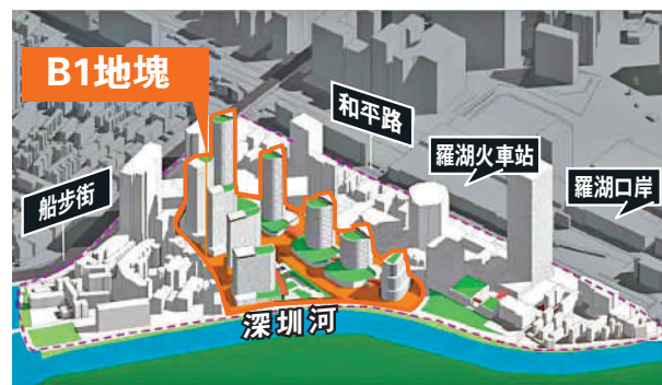
B1地塊具體位置示意圖。