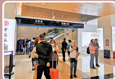
羅湖將力爭與香港打造30分鐘城際通勤圈。圖為蓮塘口岸。