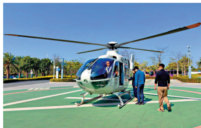
截至2023年底，4條航線飛行近300架次。圖為乘客正在有序登機。

億級產業集群的重要機遇，深圳在產業基礎、政策環境、空域條件等方面擁有一定先發優勢，具備發展低空經濟的良好條件。坪山區將加快出台低空專項規劃和政策，以工業無人機、eVTOL（純電動垂直起降飛機）的整機研發製造為核心，打造「感知系統」「輕量化材料」兩大製造業細分領域集群，以及「檢驗檢測」「低空飛行運營」兩大生產性服務業細分領域集群。大力招引飛控系統、主控芯片等核心零部件的上下游企業，培育完善低空產業生態，提升產業集聚發展水平。