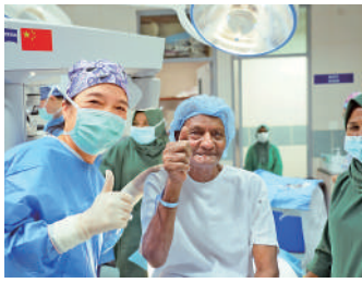
▲在中馬眼科中心，當地患者手術成功後感謝中國眼科醫療隊。

●中馬眼科中心是中國在國外援助開設的第一家現代化、標準化的眼科中心，是中馬之間首個在衛生領域開展的合作項目。通過線上、線下方式培訓當地醫護人員，幫助數以百計的眼疾患者重見光明。