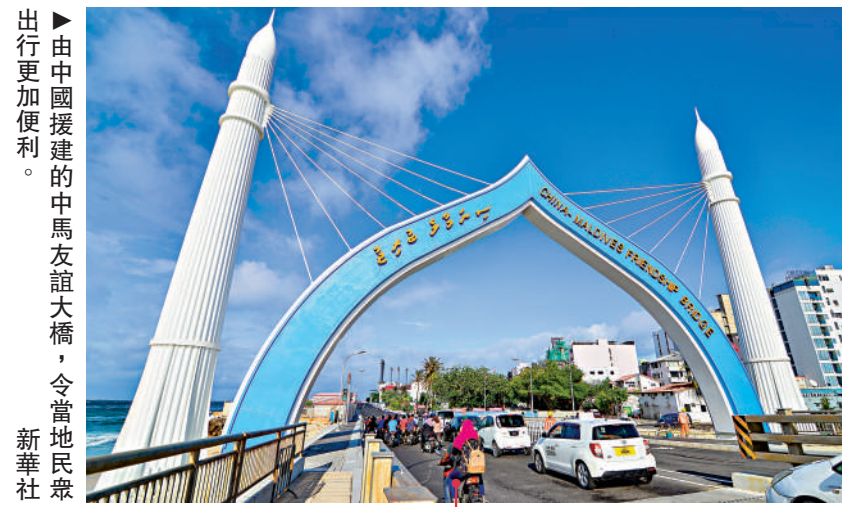
▶由中國援建的中馬友誼大橋，令當地民衆出行更加便利。

習近平指出，中國和馬爾代夫是傳統友好近鄰，兩國人民通過古代海上絲綢之路建立友好聯繫。中馬建交52年來，兩國始終相互尊重、相互支持，樹立了大小國家平等相待、守望相助、互利共贏的典範。近年來，兩國關係深入發展，共建「一帶一路」和各領域交流合作取得豐碩成果。新形勢下，中馬關係面臨承前啟後、繼往開來的歷史契機。將中馬關係提升為全面戰略合作夥伴關係，符合中馬關係發展需要和兩國人民期待。中方願同馬方一道，不斷拓展各領域交流合作，共同致力於打造中馬命運共同體。