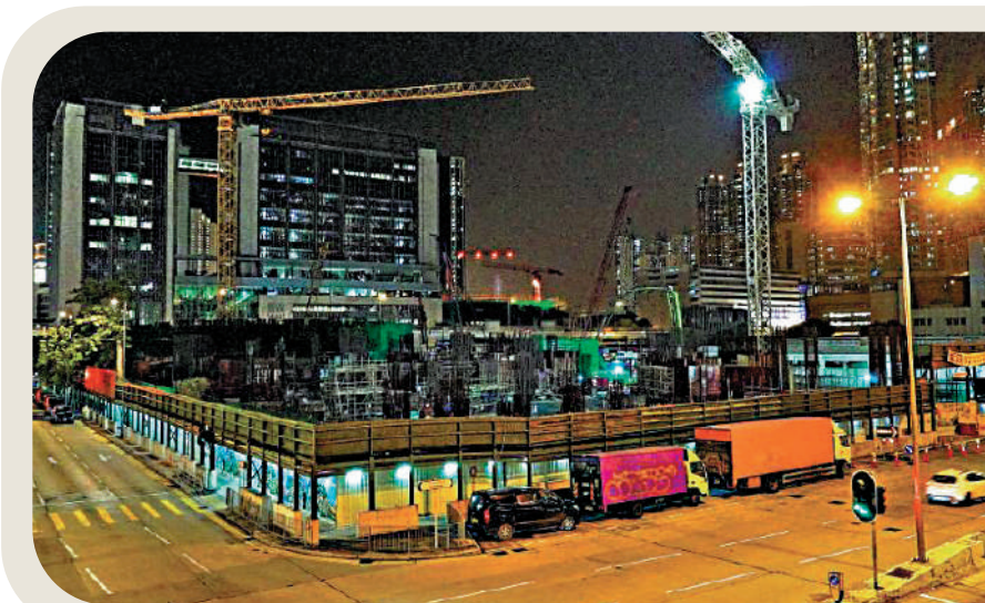
◀長沙灣東京街麗玥苑將於今年首季接受申請。