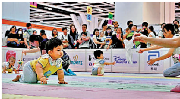
▲特區政府鼓勵生育，「家有初生優先配屋計劃」4月1日起生效，上樓輪候時間縮短一年。