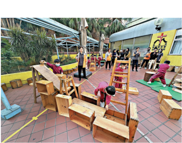
▲幼童從設計及探索滾球跑道中學習，獲益良多。

【大公報訊】記者趙之齊報道：浙江省教育廳與香港教育局在去年6月簽署合作備忘錄，將「安吉遊戲」的實踐作為促進遊戲學習教育的工作。香港幼稚園教育課程近年來亦提倡幼兒從「遊戲中學習」，與安吉遊戲的理念相近。「安吉遊戲」創始人程學琴近日來港訪問幼稚園，她表示，香港幼稚園在教育局的指引下將「遊戲中學習」落實得好，亦認為孩子在遊戲中鍛煉的種種能力會成為其成長的「後勁」。