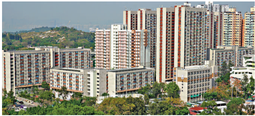
▲水邊圍邨是率先採用幸福設計指引翻新的屋邨之一。