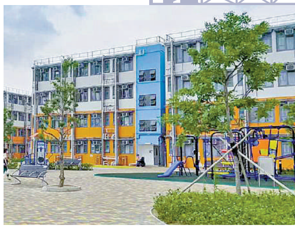
▲元朗博愛江夏圍村過渡屋環境優美。