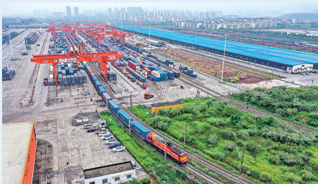
中國通過改革開放打破了計劃經濟的限制，積極引入市場經濟機制，促進資源的有效配置和經濟的快速增長。

展望今年首季，美國減息的呼聲愈來愈高，相信籠罩本港經濟多時的「高息壓力」將慢慢消散。筆者相信，樓市最快在春節前爆發「小陽春」，無論新盤或二手的成交都有望加快。事實上，近日已見「聰明錢」入市的跡象。「美聯信心指數」最新報58.7點，按周升1.4%，連升三周。市場信心上升，除了減息預期外，亦因為客戶陸續入市，令減價盤加快消化引致。只要外圍經濟環境保持穩定，相信今年首季樓市的表現將遠優於去年第四季。