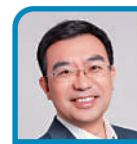
宏觀經濟 何帆 北京大學匯豐商學院 經濟學教授

節儉對個體來說是理性選擇，對整體而言一定是理性的嗎？這就不一定。從微觀經濟學進入宏觀經濟學，經常會遇到這樣的問題。微觀經濟學覺得不證自明，到了宏觀經濟學那裏就得再思量一番了。這有點像牛頓力學和量子力學的區別。牛頓力學更符合我們的日常經驗，微觀經濟學也一樣。量子力學卻會告訴我們一些看起來匪夷所思的事情，比如光既是一種波，又是一種粒子。比如兩個粒子會相互糾纏，即使距離遙遠，一個粒子的狀態發生了改變，也能影響到另一個粒子的狀態。宏觀經濟學裏也有很多這種看似與我們的日常經驗違背的奇異現象。