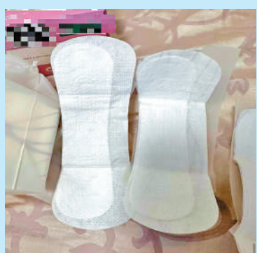
▲護墊內層竟側向一邊。