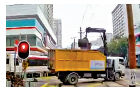
▲一輛夾斗車疑因吊臂未收好，駛至輕鐵安定站和市中心站之間時，吊臂勾斷了輕鐵架空電纜。

事發在昨日上午8時15分，一輛夾斗車由友愛路駛過屯門鄉事會路時，懷疑因吊臂未收好，駛至輕鐵安定站和市中心站之間時，吊臂勾斷了輕鐵架空電纜，從網上的行車記錄儀片段顯示，事發地點是一個十字路口，該輛夾斗車駛經安定站對開時，吊臂勾到輕鐵電纜，電纜冒出火光及白煙，一段約10米長的架空電纜垂下，吊臂上下搖晃，貨車隨後慢慢剎停，一輛輕鐵停在路口無再前行，夾斗車司機在事後報警。警員接報到場後證實事件中無人受傷，消防協助疏散244名乘客經輕鐵逃生門落車，港鐵職員亦在場協助。