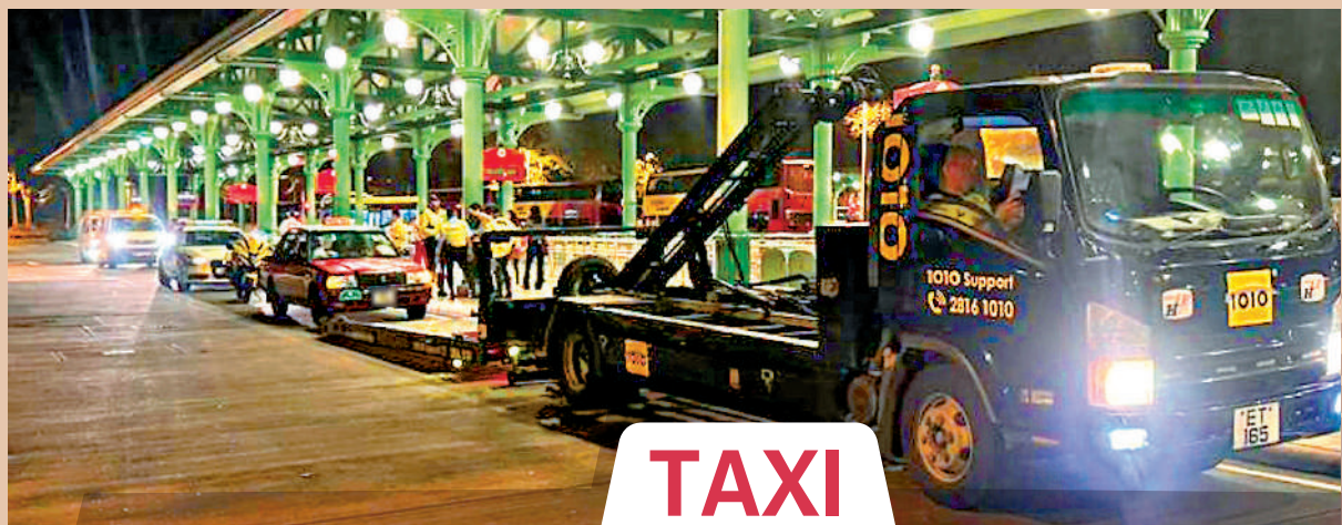
◀行動中有的士涉嫌違規被拖走。

▲警方日前在尖沙咀採取行動，派警員扮作乘客「放蛇」，打擊的士濫收車資、拒載等違規行為。